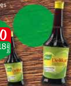
KNORR Przyprawa w płynie Delikat 860ml