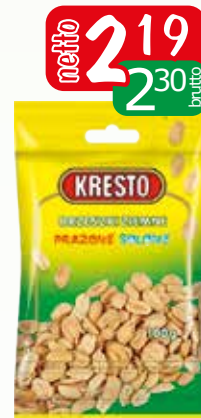
orzechy ziemne praż/solo 100g