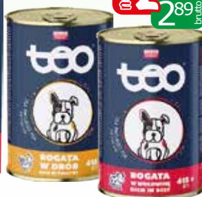
karma dla psa puszk. 415g drob, wotowina