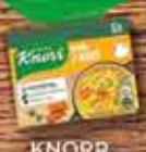
KNORR Buliony 3L