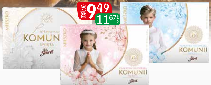
bomb twój sekret 139g