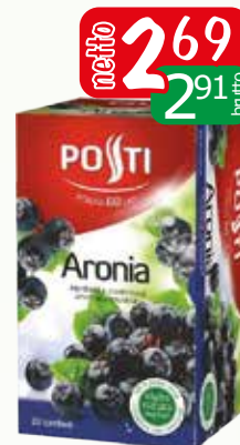
herb aronia 20x2g