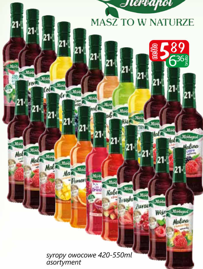
syropy owocowe 420-550ml asortyment