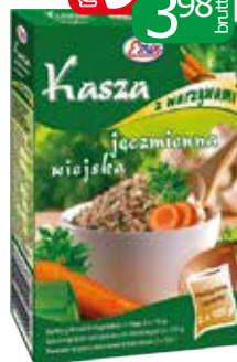
kasza jęczmienna z warz 2x125g