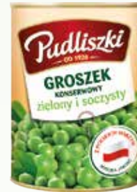
grostek konserwowy pu 400g