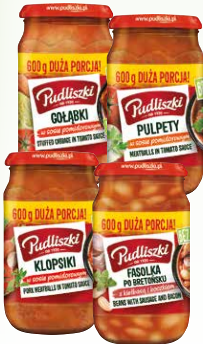
fasolka po bret bocz/kiel 600g gołąbki w s pomidorowym 600g klopsiki w sosie pomidor 600g pulpety w s pomidorowym 600g