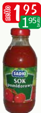
sok pomidorowy 330ml