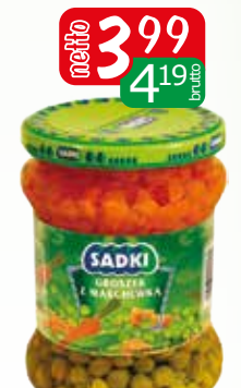
marchew z groszkiem 460g