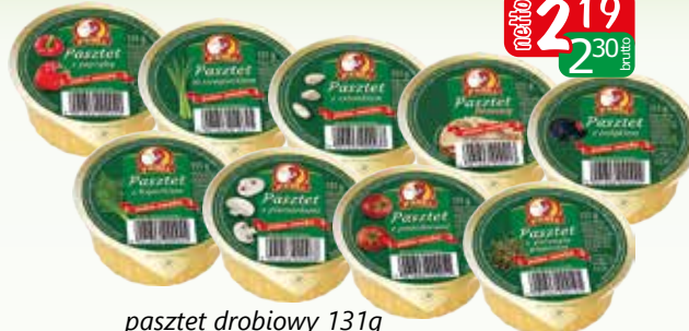
pasztet drobiowy 131g pomidor/bazylią, czosnek, firmowy, indyk, koperek, papryka, pieczar, pieprz, pomidor, szczypior,