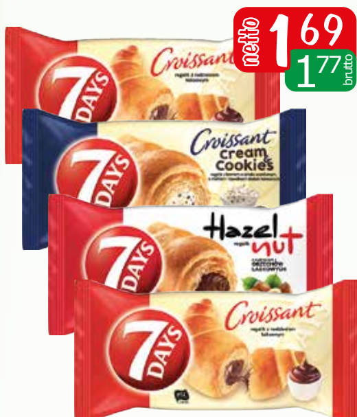
rogalik 7days 60g kr.orz.ciaστ., orzechowy, czekoladowy, wan.kre/cooc, spumante