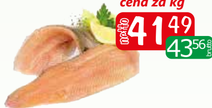
pstrąg fil 150-200 z/s iąf