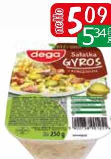
sałatka gyros 250g