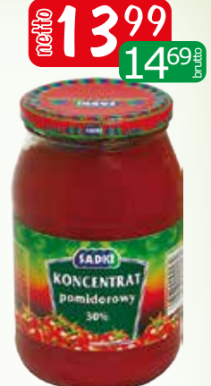
koncentrat pomidorowy 950g