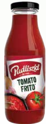
tomato frito baza pomid 500g