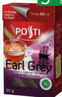
herb earl grey liściasta 80g