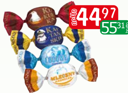
cuk. kapitańskie 3kg cuk. kukutki 3kg cuk. landrynki lodowe 3kg cuk. mleczne 3kg