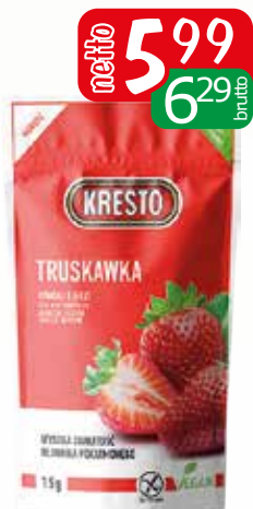
truskawka liofilizowany 15g