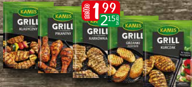
grill grzanki złociste 15g, grill karkówka 20g grill klasyczny 25g, grill kurczak 18g grill pikantny 25g