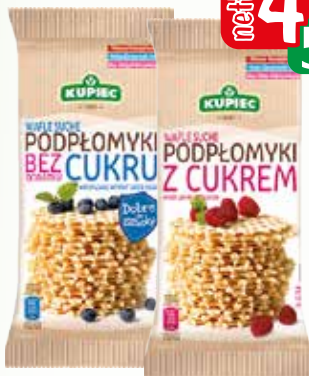
podpłomyki fol. 140g b/cukru, z cukrem