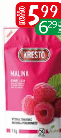
malina liofilizowany 15g