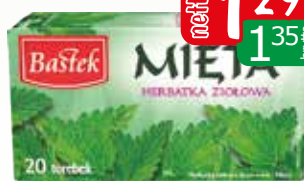
herbata mięta ex20 20g