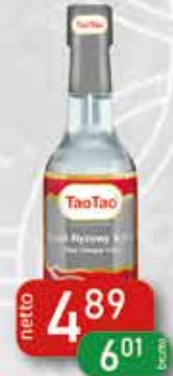
Olej Sezamowy 150 ml