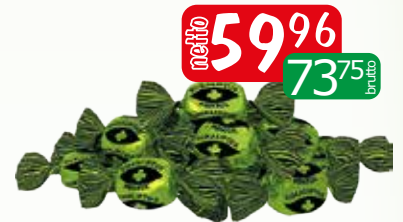
cuk eukaliptusowo- miętowe 4kg