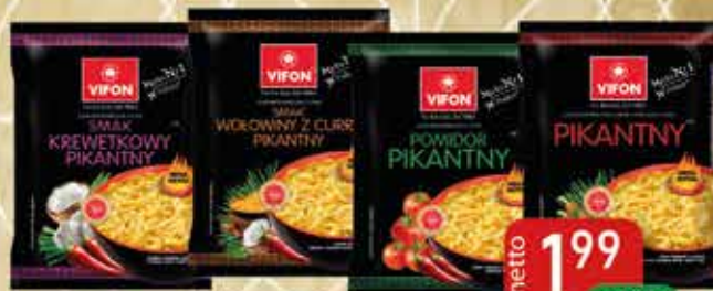
Zupa Błyskawiczna 70g Krewetka Pikantny, Pomidor Pikantny, Kurczak Pikantny, Wołowina z Curry