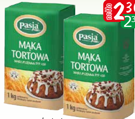
mąka tortowa typ 450 1kg

Oferta aktualna jeżeli nie wystąpił błąd w druku lub do wyczerpania zapasów.