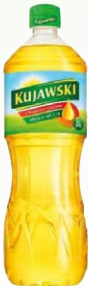
olej kujawski 1l