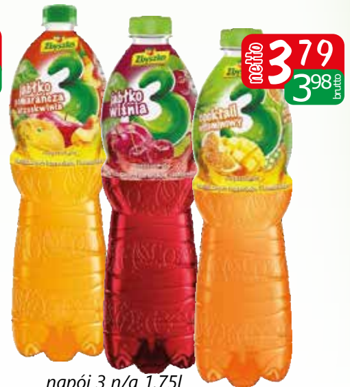
napój 3 n/g 1.75l coctail wit, jabłko-wiśń, jab-pom-brz, lim/cytr/jab.

Oferta aktualna jeżeli nie wystąpił błąd w druku lub do wyczerpania zapasów.