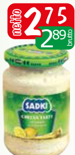
chrzan tarty 170g