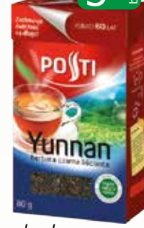
herb yunan liściasta 80g