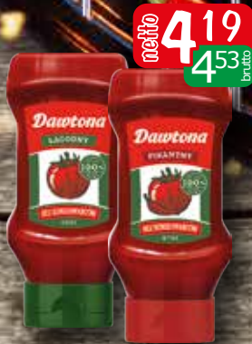
ketchup pl 450g pikantny, łagodny