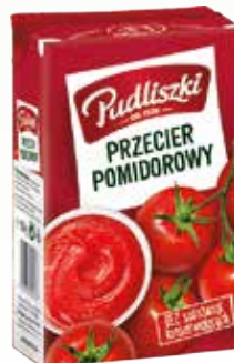
przecier pomidorowy ka 500g