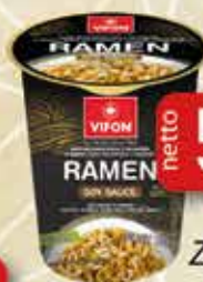
Zupa Błyskawiczna Kubek 60g Ramen z wakame