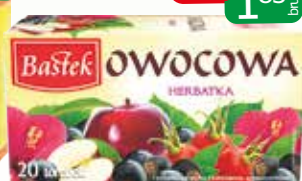
herbata owocowa ex20 40g liść 100g