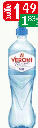
woda mineral pure 700ml