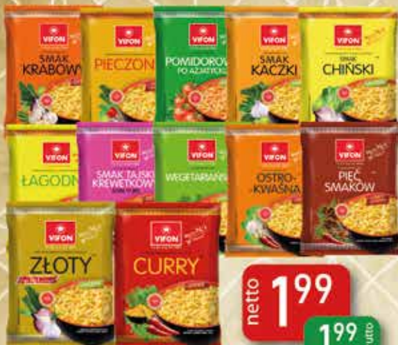
Zupa Błyskawiczna 70g Krabowa, Kurczak Pieczony, Pomidorowa po Azji, Kaczka, Kurczak Chiński, Kurczak Łagodny, Krewetkowa, Wege, Ostro-kwaśna, 5 Smaków, Kurczak Złoty, Kurczak Curry