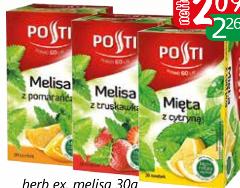
herb ex. melisa 30g z pomarańczą, z truskawką, z cytryną

Oferta aktualna jeżeli nie wystąpił błąd w druku lub do wyczerpania zapasów.