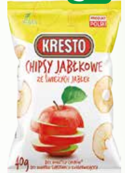
chipsy jabłkowe 40g