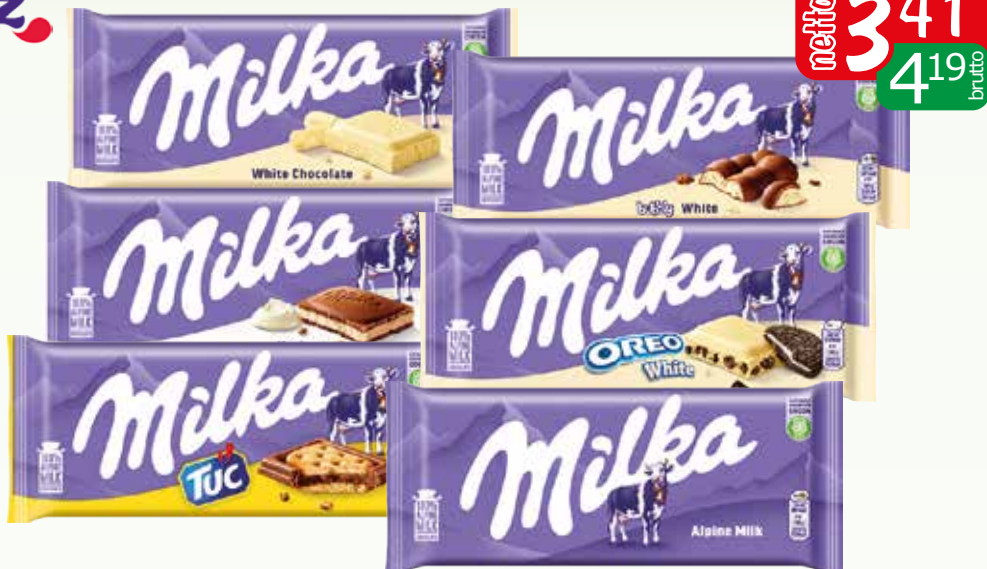
czek milka 85-100g asortyment