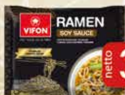
Zupa Błyskawiczna Ramen 80 g