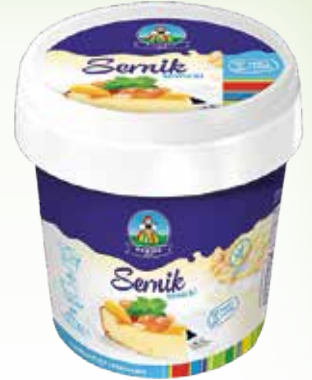
twaróg sernikowy 1 kg