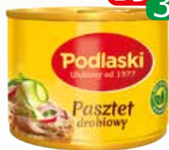
pasztet podlaski 195g