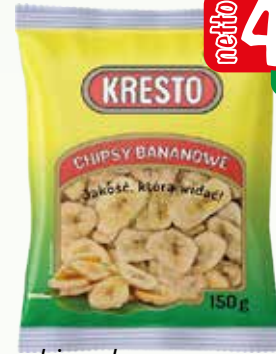
chipsy bananowe 12x 150g