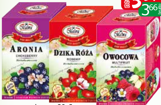
her. ex 20x2g aronia, owoc głóg, owoc róży, owocowa