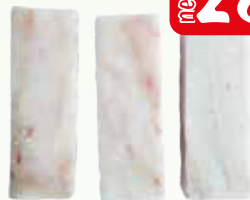
dorsz czarny porcje 110g luz