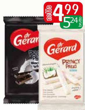
pryncypatki 200g black&white, kokosowe