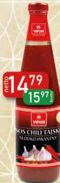
Sos Chili Tajski Słodko-Pikantny 700 g