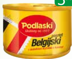
pasztet belgijski 160g