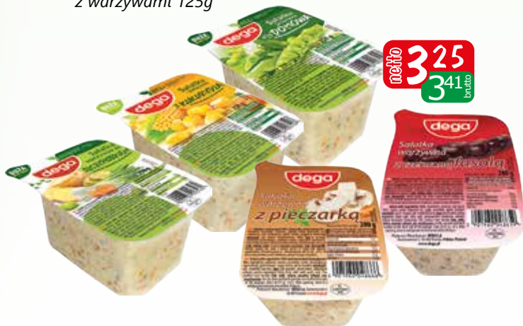
sałatki warzywne 250g