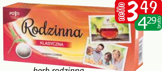
herb rodzinna czarna 80x1,4g