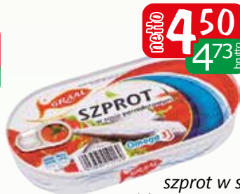
szprot w sosie pomidorowym 170g