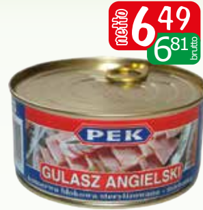
konserwa gulasz angielski 300g