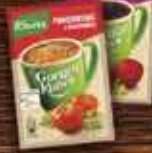
KNORR Gorący Kubek