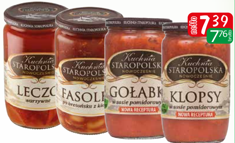
gołąbki w sosie pomidor. 700g, klopsiki w sosie pomid. 700g, leczko warzywne 660g, pulpety w sosie pomid. 700g, fasola po bretońsku 700g