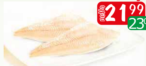
morszczuk fil b/s 60-200 shp luz