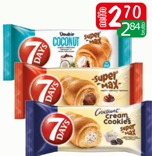
rogalik 7days 100-110g czek/kokos, wan/cookies, czekoladowy, doub.cz/wa., orz.krem/co, van.truskaw, vanilia, wan/wiśnia