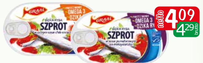
szprot w sosie pomidorowym 170g po meksykańsku, chili-sriracha