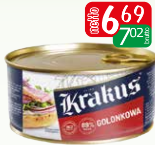
konserwa golonkowa 300g