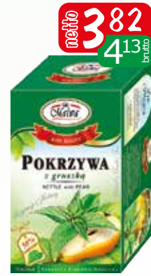
her.ex 20x2g melisa z pomar, pokrzywa grusz