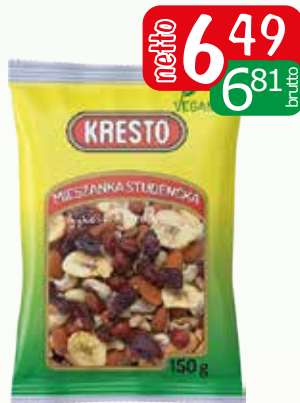
mieszanka studencka 150g