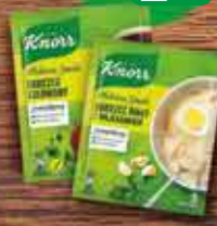
KNORR Zupy suche Ulubione Smaki