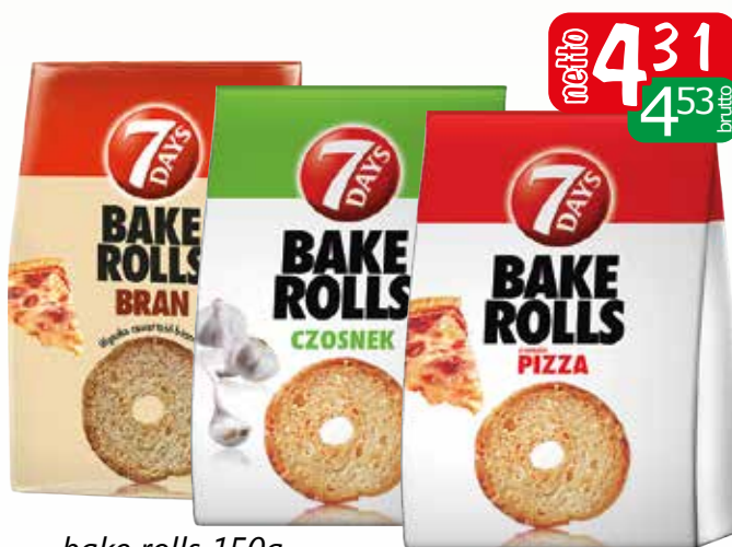
bake rolls 150g bekon, bran pizza, czosnek, pizza, śmiet/cebula, pomidor oliwki