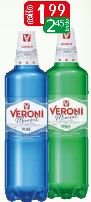
woda minerala 1,5l perle gaz, pure n/gaz