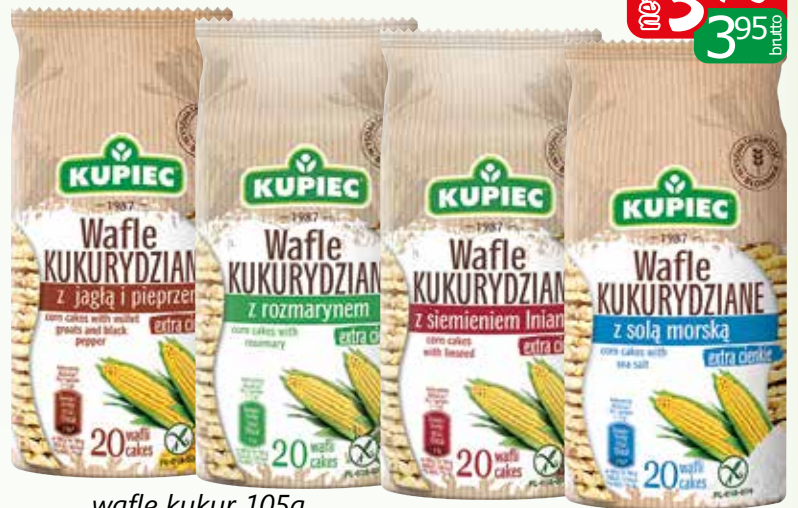
wafle kukur 105g rozmaryn, siem lniane, jagła/pieprz, sól morską