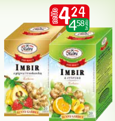
imbir ex 20x2g cytryna, pigwa+truskawka