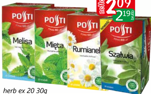
herb ex 20 30g melisa, mięta, szalwia, pokrzywa, rumianek