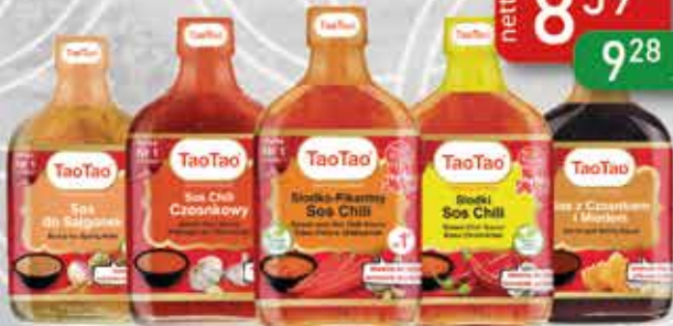
Sos 200-220 g do Sajgonek, Chili Czosnkowy, Chili Słodko-Pikantny, Chili Słodki, z Czosnkiem i Miodem