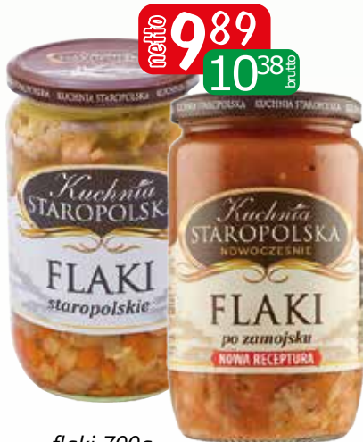
flaki 700g staropolskie, po zamojsku