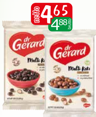
maltikeks chocolate 200g maltikeks milk.chocolate 200g