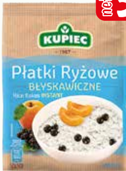
płatki ryżowe fol (6szt) 250g