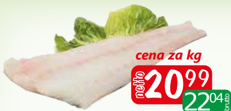
dorsz czarny fil b/s 8-16 shp