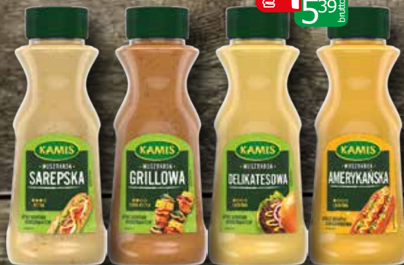
musztarda pet 290g amerykańska, sarepska, delikatesowa, grillowa