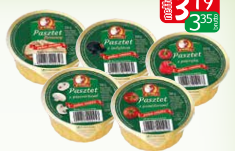
pasztet drobiowy 250g firmowy, pomidorowy, z indykiem, z papryką, z pieczarkami