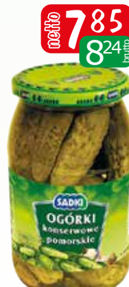
ogórki konserwowe pomorskie 900ml