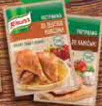
KNORR Przyprawy specjalistyczne