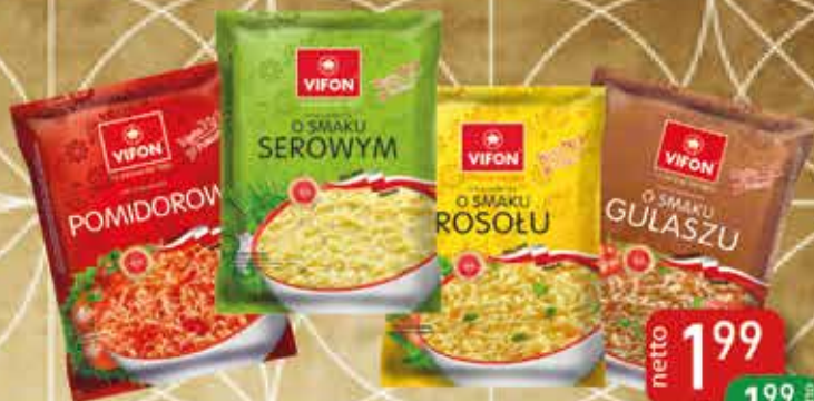
Zupa Błyskawiczna Polskie Smaki 65 g Pomidorowa, Serowa, Rosół, Gulaszowa