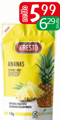
ananas liofilizowany 15g