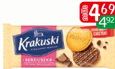
ciast serduszka w cz.mle 171g