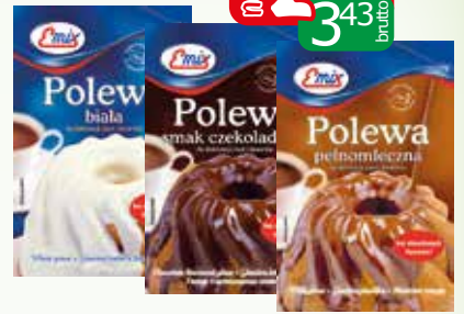
polewa twarzą 100g biała, czekoladowa, pełnomleczna