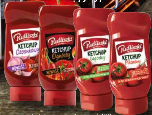
ketchup czosnkowy pl 480g ketchup ognisty pl 480g ketchup pikantny pl 480g ketchup łagodny pl 480g