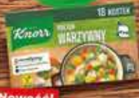
KNORR Buliony 9L