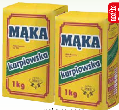
mąka pszena kurpiowska 500 1kg