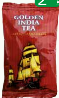
herb gran golden india 100g