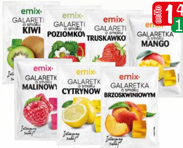
galaretka 75-79g asortyment