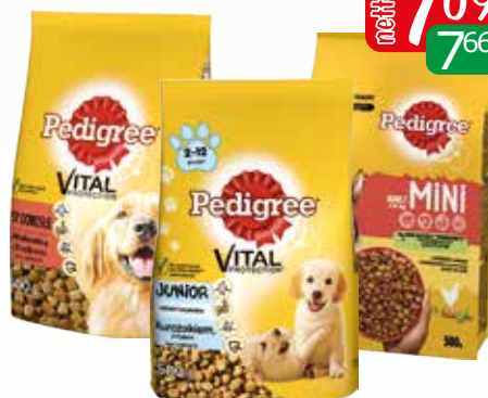
suche 500g junior drob, kurczak mate ra., wotowina/drob