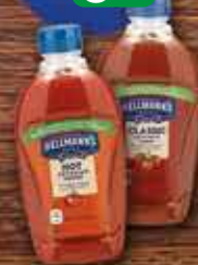
HELLMANN'S Ketchup 470g/485g