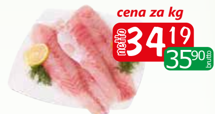
okoń nilowy fil b/s 300-500 iwpluz