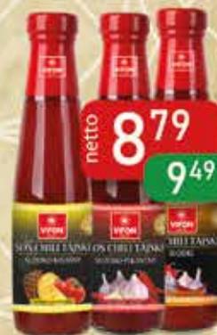
Sos Chili Tajski 250 ml Sl-Pik, Słodki, Sl-Kwa