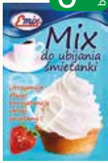
mix do bitych śmietany 9g