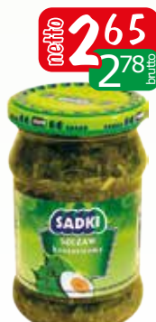
szczaw siekany 280g