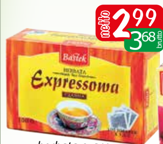
herbata czarna ex 100 150g