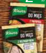
KNORR Przyprawy specjalistyczne