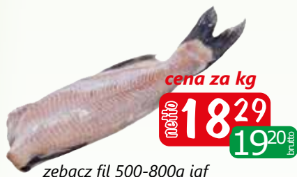
zębacz fil 500-800g iąf