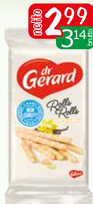
rolls wanilia 144g