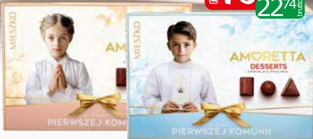
bomb amoretta 276-280g classic, desserts