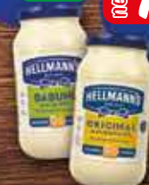
HELLMANN'S Majonez 340ml