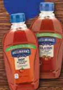
HELLMANN'S Ketchup 825g/840g