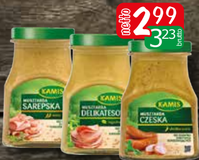
musztarda 180-185g delikatesowa, czeska, sarepska