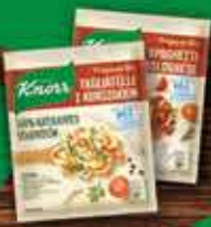
KNORR Fixy Naturalnie Smaczne