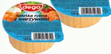
sałatka rybna z warzywami 125g