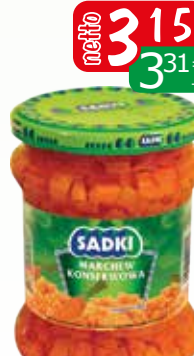
marchew kostka 480g