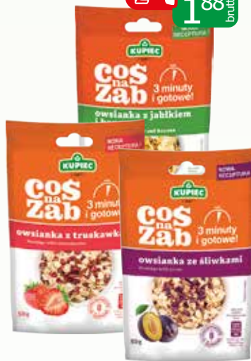
owsianka 50g asortyment