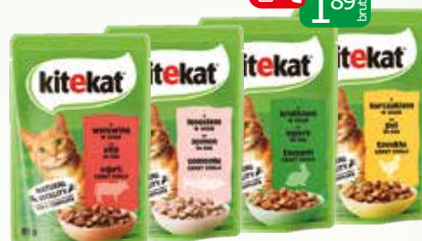
saszetka w sosie 85g krolik, kurczak, wotowina, loso