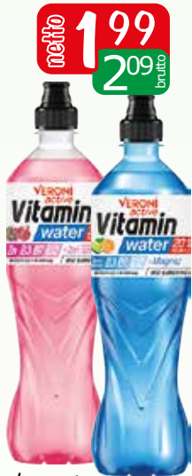
woda water z magnezem 700ml, woda witamin żeń-szeń 700g