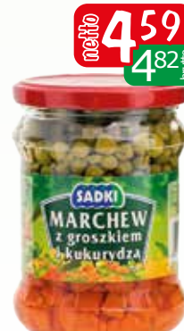
marchew z groszkiem i kukurydzą 460g