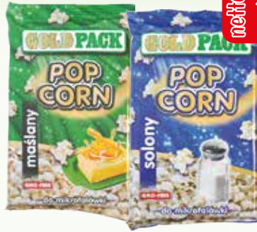
popcorn do mikrof 100g maśl, solony