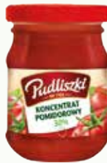
koncentrat pomid 30% st 90g