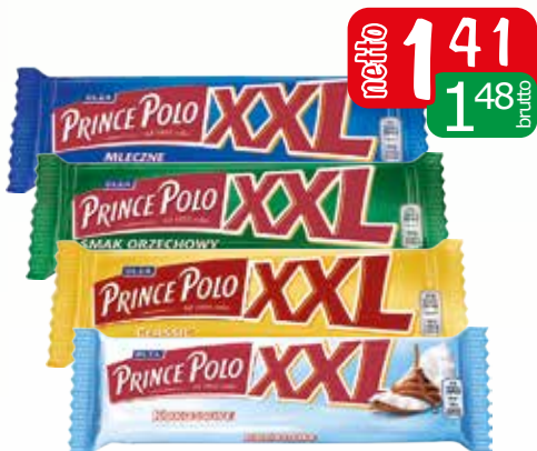
wafel xxl 50g black, classic, kokos, mleczny, orzechowy, solony karmel