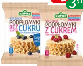
podpłomyki 70g b/c, z cukrem