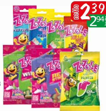
żelki zozole 75g asortyment