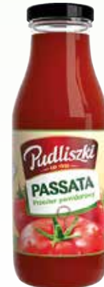
passata pomidorowa 500g