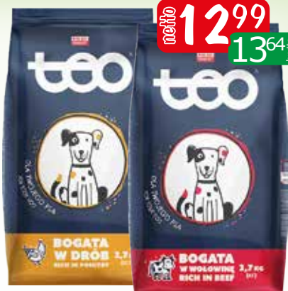
karma sucha dla psa 2,7kg drob, wolo