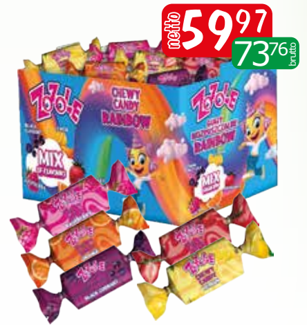
cuk.guma rozpuszcz. reinb. 3kg