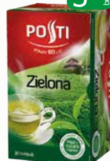
herb zielona ex 20 40g