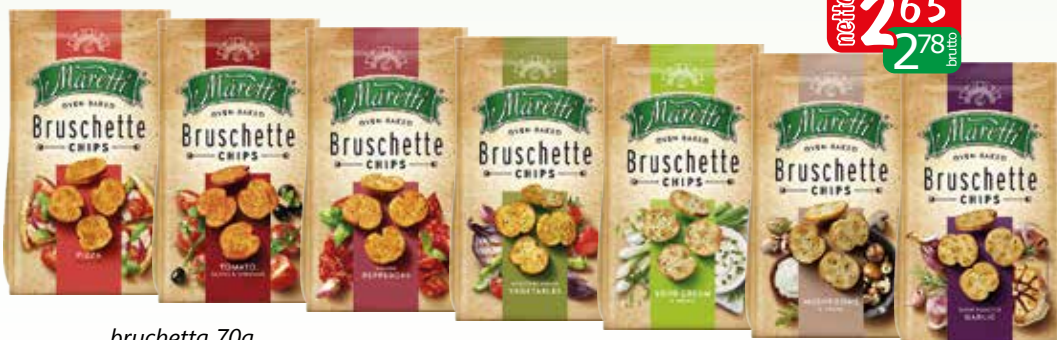
bruschetta 70g czosnek, grzyby, mix warzyw, pizza, pomidor, salami peperoni, smietana/cebula