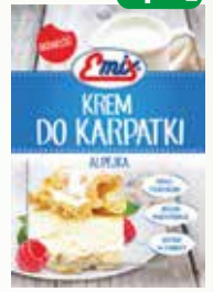
krem do karparki 3 minut 140g