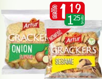
krakersy 90g cebulowe, sezam