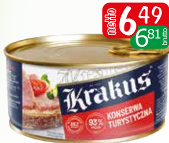
konserwa turystyczna luksusowa 300g