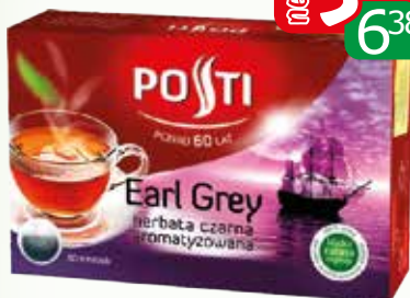
herb earl grey ex80 120g