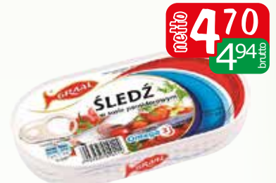
śledź w sosie pomidorowym 170g