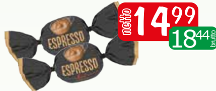
cukierki espresso 1kg