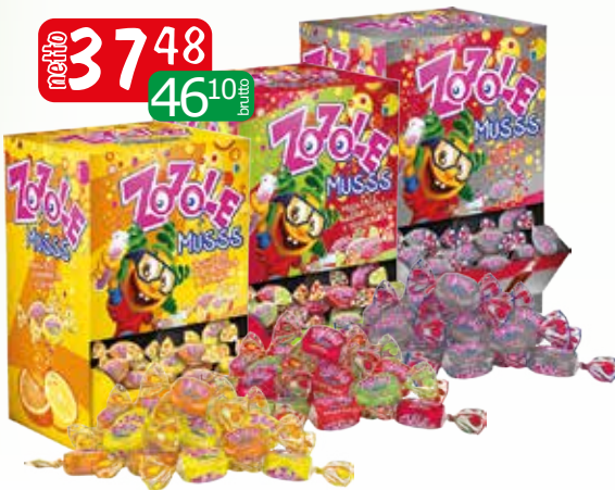
cuk zozole 2.5kg cola, jabł/trus/wi, orange/lemono