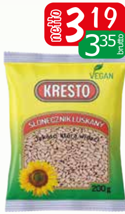
słonecznik łuskany 200g