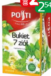
herb bukiet 7 ziół ex20 30g