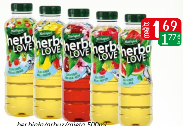
her.biała/arbuz/mięta 500ml her.biała/malina/lipa 500ml her.czar/wiśnia/skrzyp 500ml her.zielona /mango/pokrzywa 500ml her.zielona /poziomka/rumianek 500ml