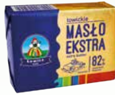
masło łowickie 200g