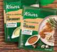
KNORR Sosy suche Menu ze smakiem