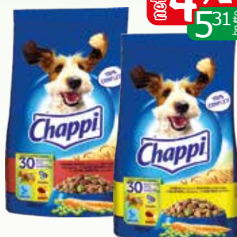
sucha drob 500g sucha drob/wotowina 500g