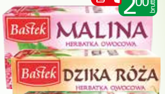
herbata dzika róża ex20 40g herbata malinowa 20x2g 40g herbata żurawina 20x2g 40g