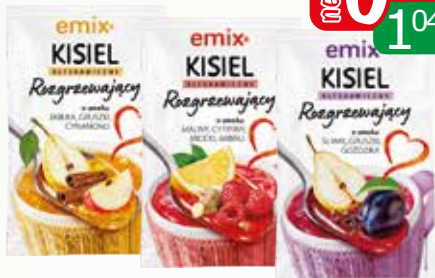
kisiel błys 30g asortyment