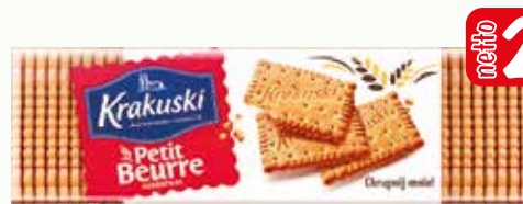
ciast herb petit beurre 220g