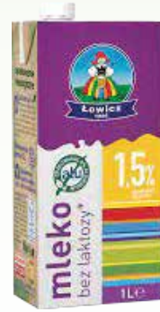
mleko łowickie b/lak 1,5% 1l uht