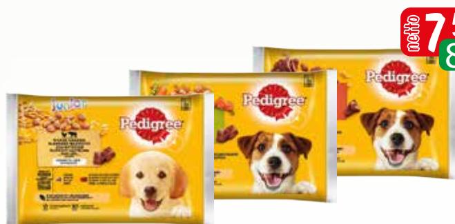
sasz. 4x100g junior kur/wol/ryz, kur/warz/wol/warz., wotow/drob