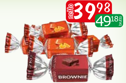
cuk brandy&orange 2.5kg cuk brownie z wiśnią 2,5kg