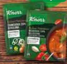
KNORR Zupy suche Rozkosze Podniebienia