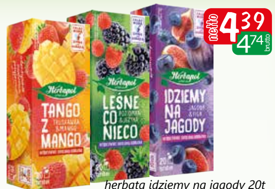
herbata idziemy na jagody 20t herbata lesne co nieco 20t herbata tango z mango