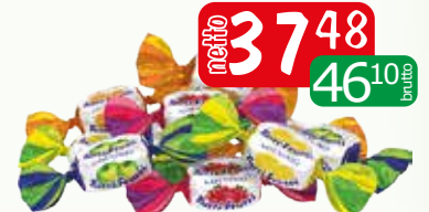
cuk tutti frutti mix 2.5kg