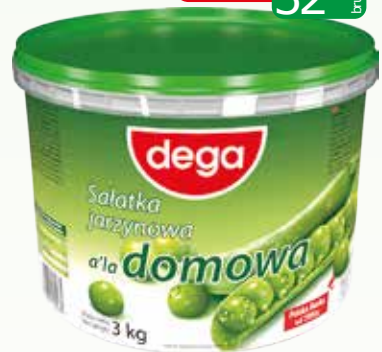
sałatka jarzynowa a'la domowa 3kg