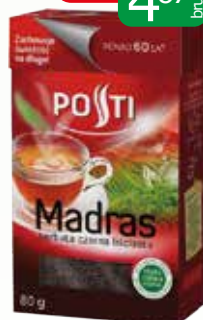
herb madras liściasta 80g