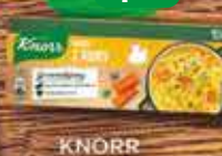
KNORR Buliony 6L