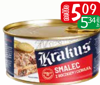
smalec z boczkiem i cebulka 300g