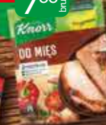
KNORR Przyprawa do mięs 200g