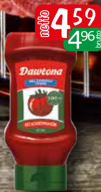
ketchup bez dodatku cukru 450g