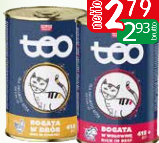
karma dla kota puszk 415g drob, wotowina