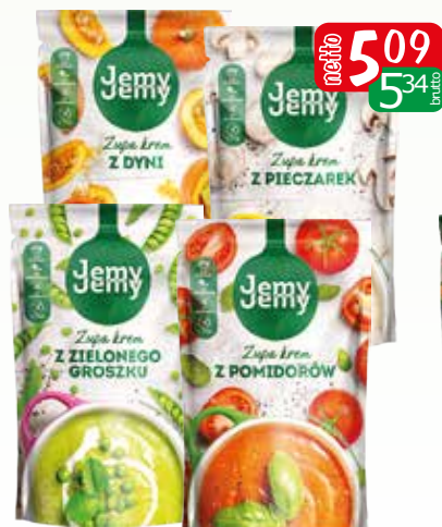
zupa krem 375g z dyni, z pieczarek, z pomidorow, z zielonego groszku