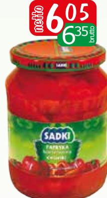
papryka konserwowa cwiartki 680g