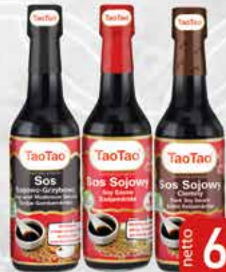
Sos 150 ml Sojowo-Grzybowy, Sojowy, Sojowy Ciemny