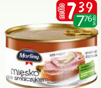
mięsko ze smalczykiem 400g