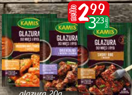
glazura 20g bbq, orientalna, miodowo-musztradowa