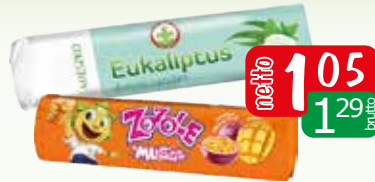
drops mango&marakuja 32g drops nowy eukaliptus 32g