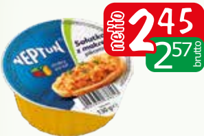
salatka pikantna z makreli 130g