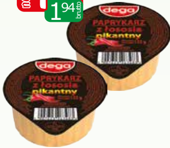
paprykarz z łososia pikantny 135g