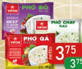
Zupa Błyskawiczna 60-65 g Pho Bo, Pho Gay, Pho Chay Wege