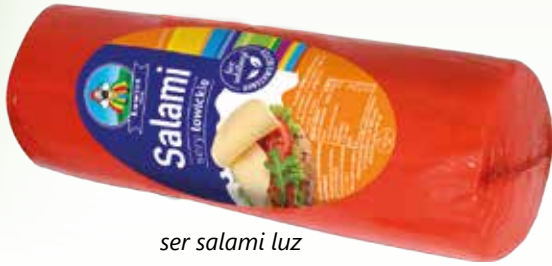
ser salami luz