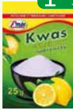
kwasek cytrynowy ze strun 25g