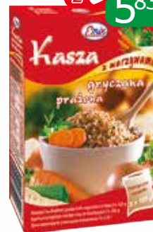
kasza gryczana z warz 2x125g