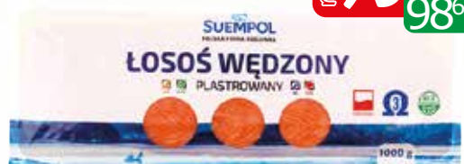
filet wędzony krojony b/s luz