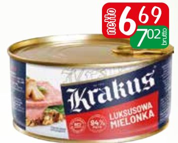
luksusowa mielonka wieprzowa 300g