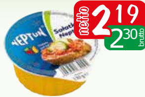
salatka rybna neptun 130g