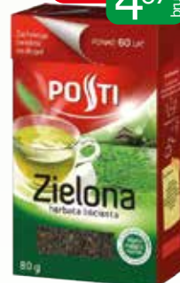
herb zielona liściasta 80g