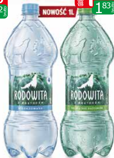
woda rodowita 1l niegaz, delikatny gaz