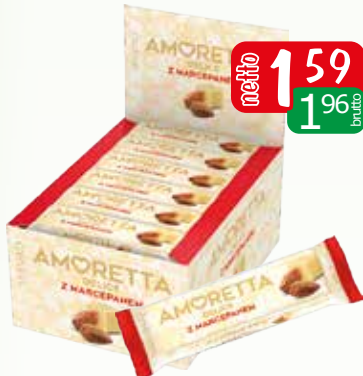
baton amoretta del. z marc. 40g