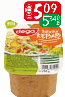
sałatka kebab 250g