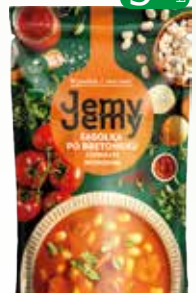
fasolka po bretoń z kiel 400g