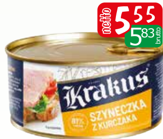
szyneczka z kurczaka 300g