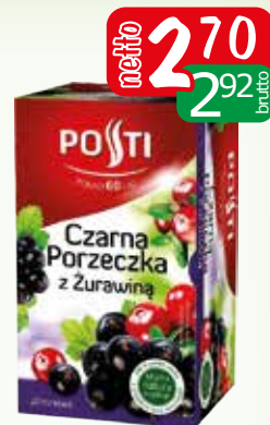
herb ex.czarna porz.z żur 40g