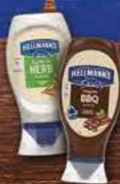
HELLMANN'S Sosy dressingowe 250ml