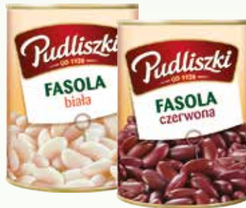
fasola biała pu 400g fasola czerwona pu 400g