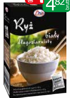
ryż z warzywami 2x125g