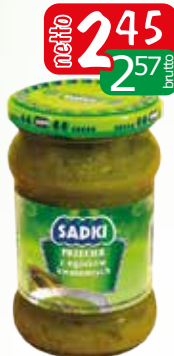
przecier z ogórków kwaszonych 280g