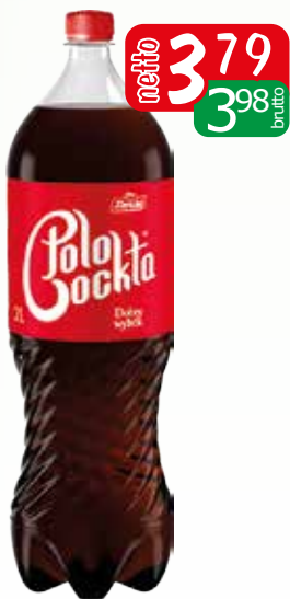
polo cocta.gaz z 20% soku 2l