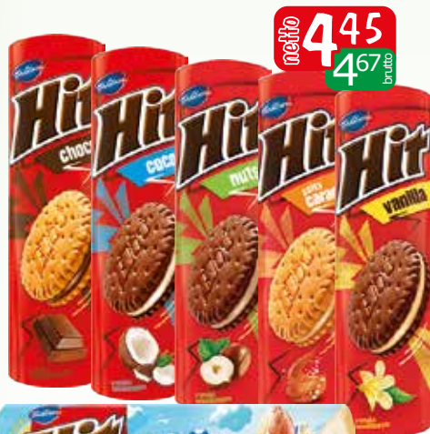
ciast hit 220g czekolada, kokos, orzech, truskawka, stony karmel, wanilia, migdal