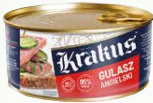
gulasz angielski 300g