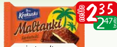
ciast maltan. pol.kak. 80g