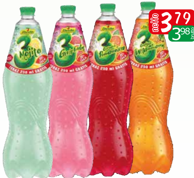
gaz z 20% soku 1,75l asortyment