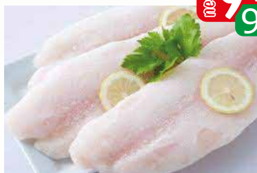
panga fil 170-220 iąf luz