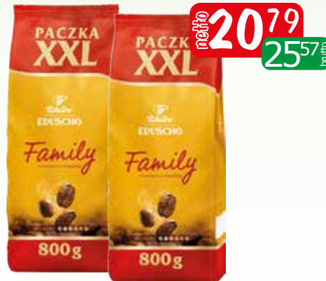
kawa mielona family 800g