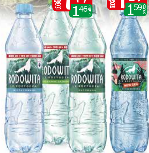
woda rodowita 0,6l gaz, niegaz, deli gaz woda rodowita sport n/gaz 0,6l