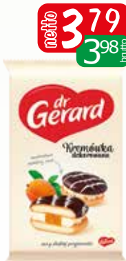
kremow dekor morela 11x165g