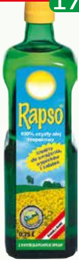
olej rapso 0,75ml