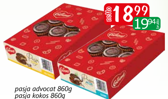
pasja advocat 860g pasja kokos 860g