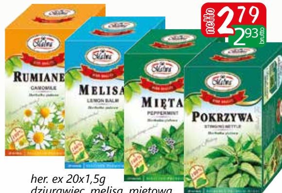
her. ex 20x1,5g dziurawiec, melisa, mięta, pokrzywa, rumianek, szalwia