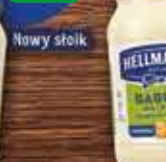
HELLMANN'S Majonez 500ml