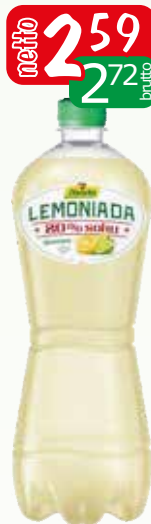
lemoniada gaz 1l cytrusowa, cytrynow lim.