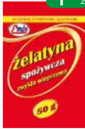
żelatyna spożywcza 50g