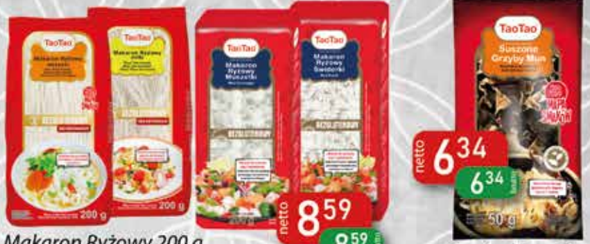
Makaron Ryżowy 200 g Wstążki, Nitki, Muszelki, Świderki