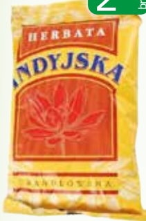
herb indyjska lotos granu 80g