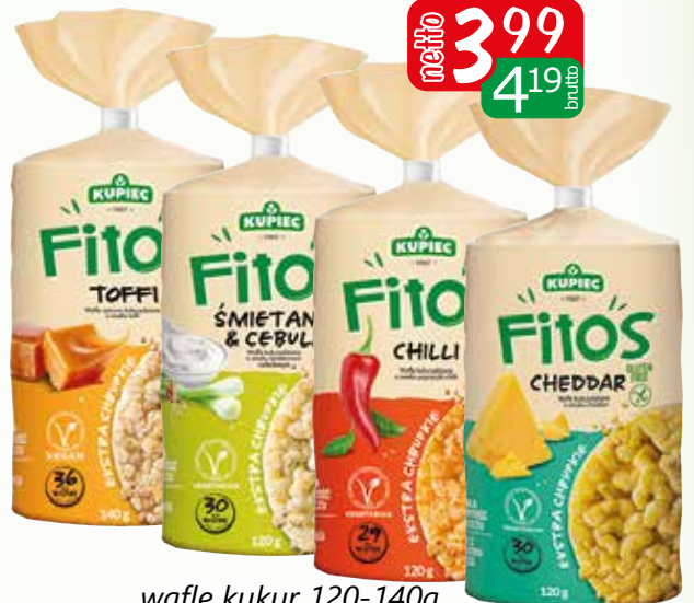
wafle kukur 120-140g chedd, chilli, śmiet&cebul, wafle ryż-kukurydz toffi 140g