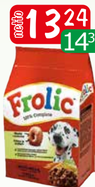
suchy wotowina 750g