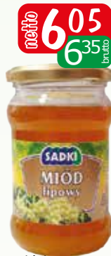
miód wielokwiatowy 370g