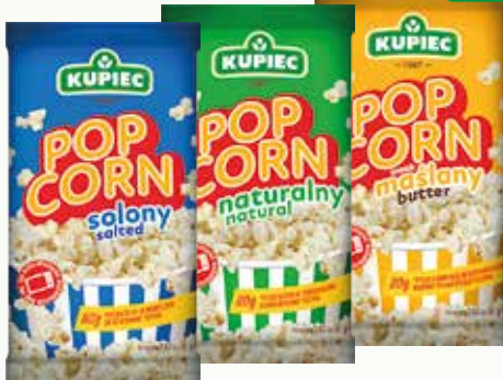
popcorn 80g naturalny, solony, o smaku masłanym