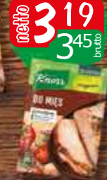
KNORR Przyprawa do mięs 75g