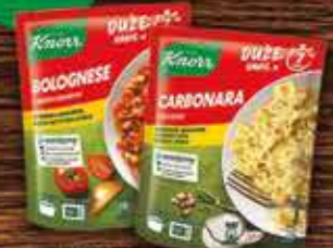
KNORR Duże Danie