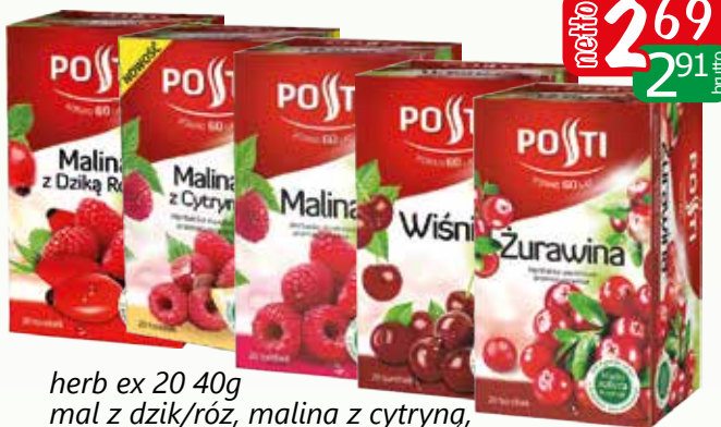
herb ex 20 40g mal z dzik/róż, malina z cytryną, malina, żurawinowa, wiśnia