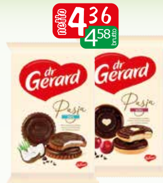
pasja 170g kokos, wisnia