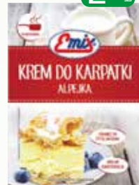
krem do karparki 200g