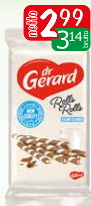
rurki waflowe zebra 144g