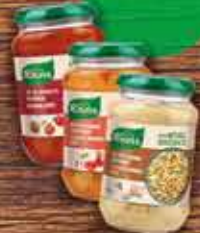
KNORR Sosy w słoiku