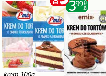
krem 100g ajerkoniak, czekoladowy, orzechowy, toffi, truskawkowy, śmietankowy