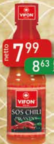
Sos Chili Pikantny 260 g