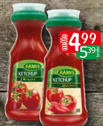
ketchup 350g pikantny, łagodny