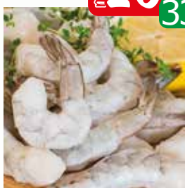
krewetka 31/40 surowa obrana z ogonkiem luz