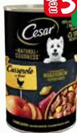
cesar nat. kurczak 400g