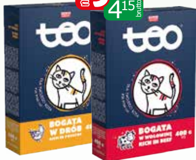
karma sucha dla kota 400g drob, wotowina