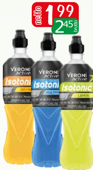
isotonic 0,7l lemon, multifruit, orange