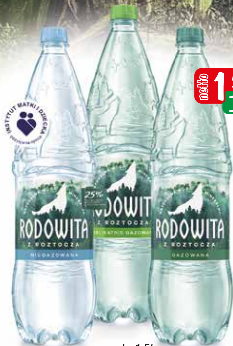
woda 1,5l gaz, niegaz, delikatny gaz