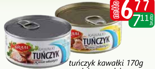
tuńczyk kawalki 170g w oleju, w wodzie