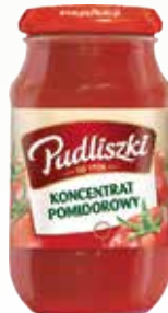
koncentrat pomid 30% st 310g