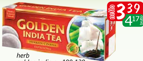
herb golden india ex 100 130g