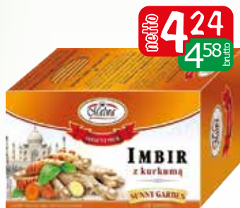
her.imbir z kurkumą ex 20x2g