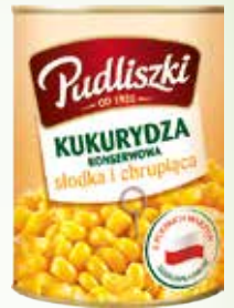
kukurydza konserwowa pu 400g