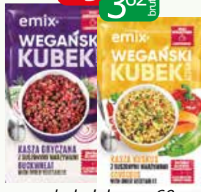
vege kubek kasza 60g gryczana, kuskus