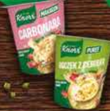
KNORR Dania w kubku