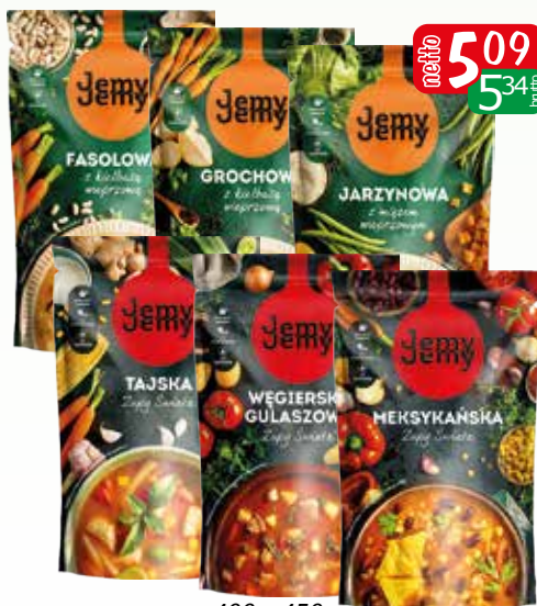
zupa 400g-450g asortyment