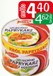
papryk szczec z łososiem 330g