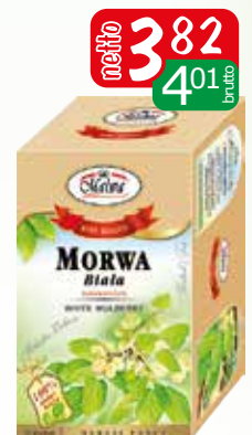
her.morwa biała ex 20x2g