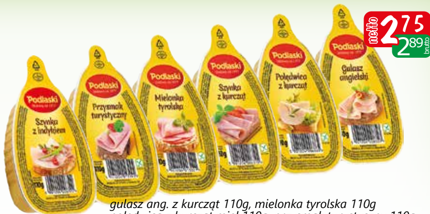
gulasz ang. z kurczak 110g, mielonka tyrolska 110g, poledwica z kurczak miel 110g, przymak turystyczny 110g, szynka z indyka mielona 110g, szynka z kurczak mielona 110g