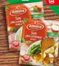
AMINO Sosy suche