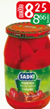
papryka konserwowa cwiartki 850g