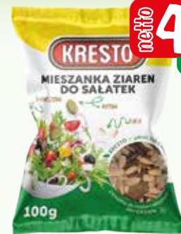
mieszanka ziaren do sał. 100g