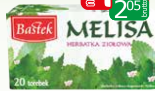
herbata melisa ex 20x1,5g 30g