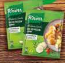
KNORR Sosy suche Ulubione smaki