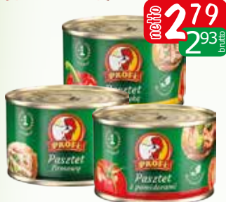
pasztet drobiowy 160g pomidor, firmowy, papryka, pieczarka