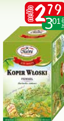
her.kop.włoski ex 20x1,5g