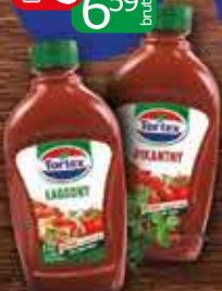
TORTEX Ketchup 470ml