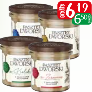
pasztet dworski 130g z dzika, z jelenia, z kaczka, z królika