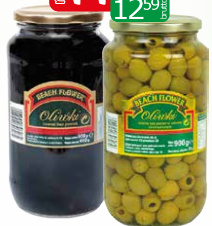
oliwki czarne 900g oliwki zielone 900g