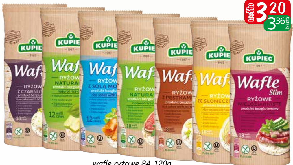
wafle ryżowe 84-120g asortyment

Oferta aktualna jeżeli nie wystąpił błąd w druku lub do wyczerpania zapasów.