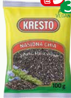
nasiona chia 100g