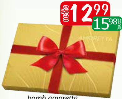
bomb amoretta delice 128g