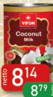
Mleczko Kokosowe 400 ml