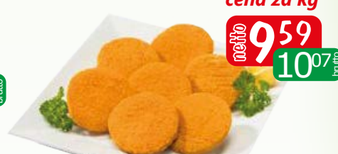
Burger rybny luz