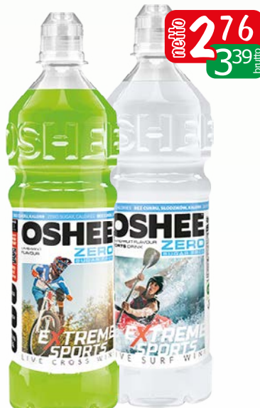
napój izot.zero 750ml asortyment