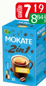
kawa 2w1 12x8g