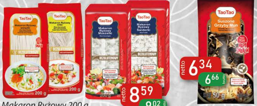
Makaron Ryżowy 200 g Wstążki, Nitki, Muszelki, Świderki