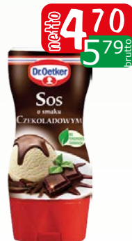
sos czekoladowy 200g