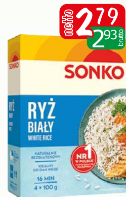
ryż biały 4x100g