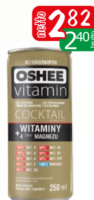
oshee 250ml coctail vitamins