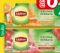
Lipton herbaty zielone 25tb