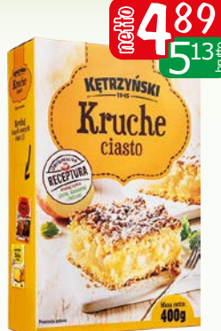
ciasto kruche 400g