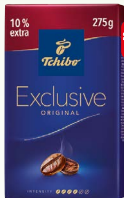
kawa mielona exclusive 275g