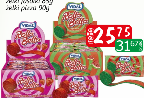
želki rolla arbuz 24x19g želki rolla truskawka 24x19g