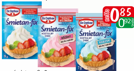
śmietan -fix 9g śmietan -fix niebieski 7g śmietan -fix różowy 7g