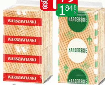
wafle warszawianki mlecz. 80g