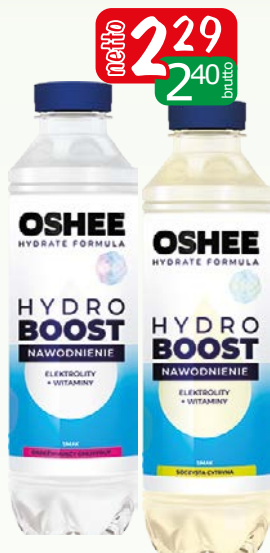
oshee hydro boost 555ml cytr., grape.