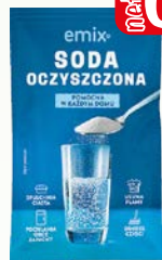
soda oczyszczona 70g