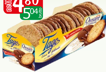
ciast owsiane de lux 210g