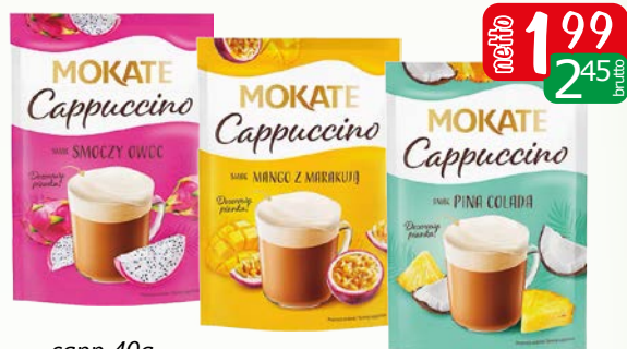
capp 40g manga z marakuja, pina colada, smoczy owoc