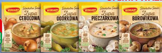
Winiary Zupa Ogórkowa 42g, Zupa Pieczarkowa 44g, Zupa Borowikowa 44g, Zupa Cebulowa 31g