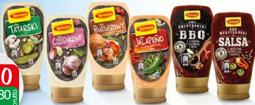
Winiary Sos Czosnkowy 300ml, Sos Tatarski 300ml, Sos Jalapeno 300ml, Sos Burgerowy 300ml, Sos Amerykański BBQ 348g, Sos Meksykański Salsa 336g