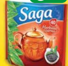
Saga herbaty czarna 40tb