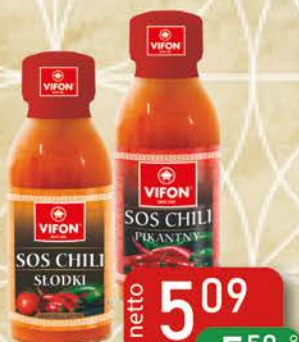
Sos 100 g Chili Pikantny, Chili Słodki