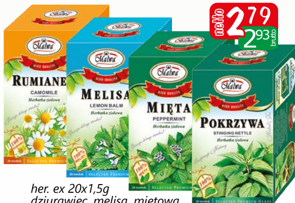
her. ex 20x1,5g dziurawiec, melisa, mięta, pokrzywa, rumianek, szatwia