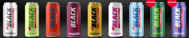
CLASSIC 500 ml, APPLE & MINT 500 ml, SPICY 500 ml, BLACK CHERRY 500 ml, TROPICAL 500 ml, MAMA BEACH 500 ml, TROPIC 500 ml, APPLE & MINT 500 ml, BLACK TEA 500 ml