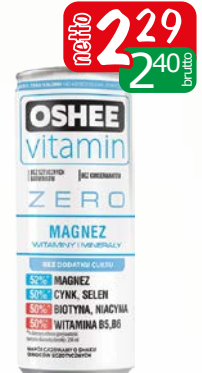
oshee 250ml energy miner.zero, energy magnez zero, recovery elektrol