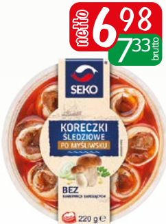
Koreczki śledziowe po myśliwsku 220g