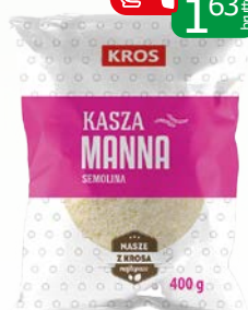
kasza manna 400g