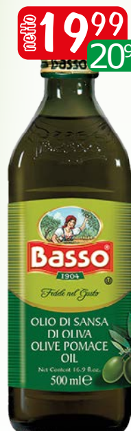
oliwa basso 0,5l