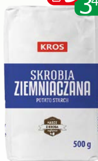
maka ziemniaczana 500g