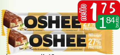
baton musli 40g limonka/wiśni, pr.wanilia-karmel