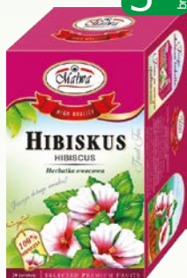
her. hibiscus 20x2g