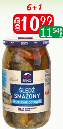
Śledź smażony w zalewie octowej 800g