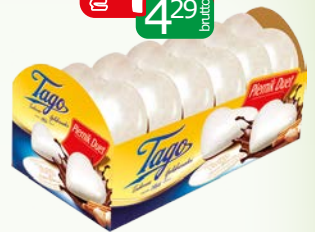
ciast piernik duet 190g