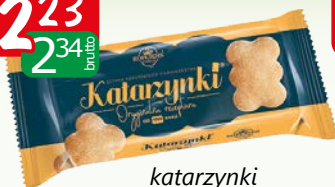
katarzynki b/czek 94g