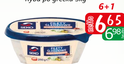
Filet śledziowy w sosie śmietanowym 250g