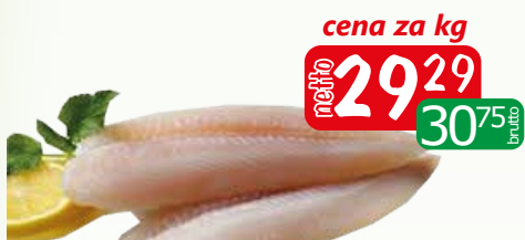
Miruna fil 450+ SHP luz