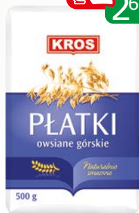
płatki owsiane górskie 500g