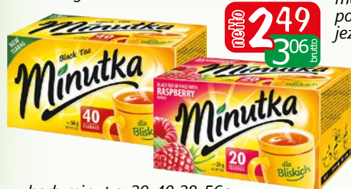
herb minut ex20-40 28-56g cytrynowa, earl grey, express, malinowa, miód witamin c