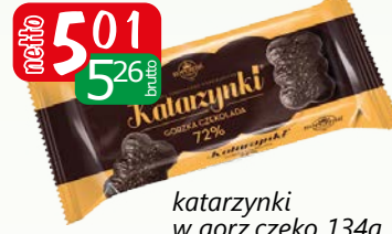
katarzynki w gorz.czeko 134g