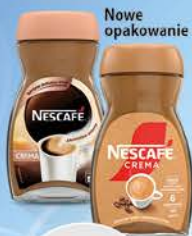
Nescafé Classic 200g