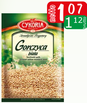
gorzycza biała 25g