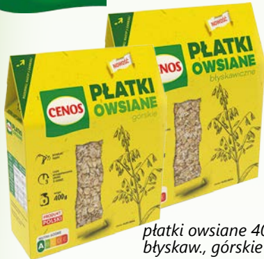
płatki owsiane 400g błyskaw., górskie