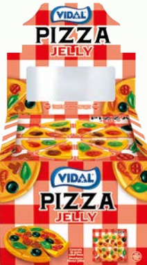
želki pizza 11x66g želki termo dragon 22x33g želki wąż 11x66g