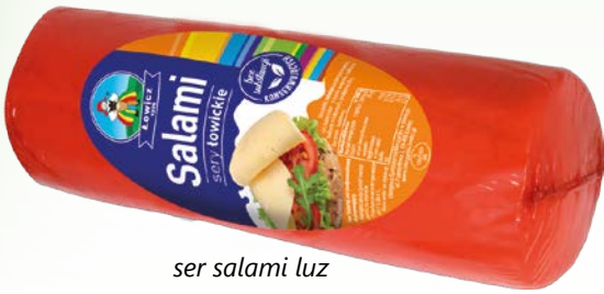
ser salami luz