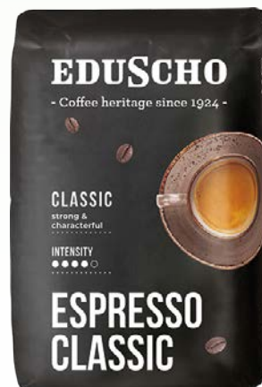
eduscho espresso classic 500gr ziarno