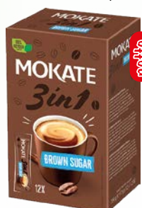
kawa 3w1 display 10*17g