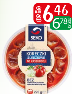
Koreczki śledziowe po kaszubsku 220g