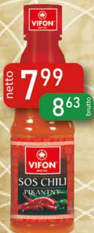
Sos Chili Pikantny 260 g