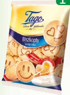
ciast biskz mazowieckie 90g