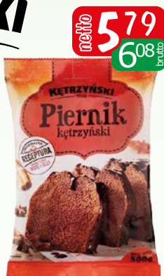
piernik kętrzyński 500g