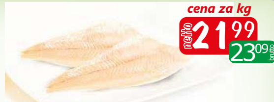
morszczuk fil b/s 60-200 shp luz