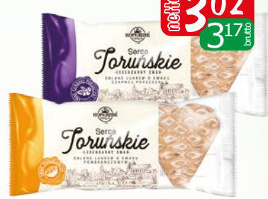
serca toruńskie 120g pomarań., porzeczk.