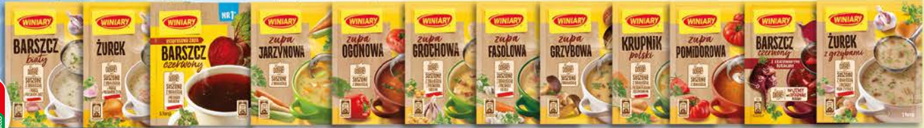
Winiary Barszcz Biały 66g, Barszcz Czerwony 49g, Żurek 49g, Żurek Z Grzybami 49g, Zupa Grochowa 75g, Zupa Pomidorowa 50g, Zupa Fasolowa 63g, Krupnik Polski 59g, Zupa Jarzynowa 48g, Zupa Ogonowa 40g, Zupa Grzybowa 48g, Barszcz Czerwony Express 60g