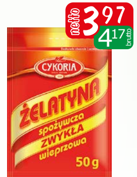
żelatyna spożywcza 50g