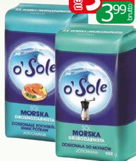
sól morska 0,9-1kg drobnoziar./jod, jodowana grub