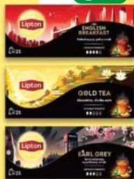
Lipton herbaty czarne specjalistyczne 25tb