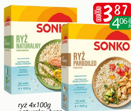
ryż 4x100g naturalny brąz, paraboiled