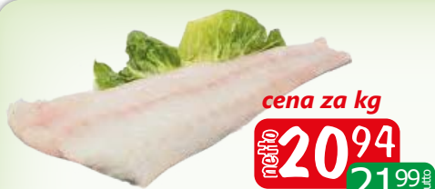
dorsz czarny fil b/s 8-16 shp