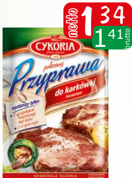
przyprawa do karkówki 35g