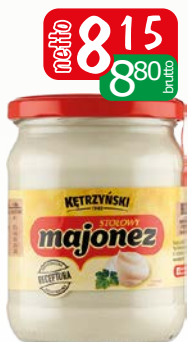
majonez kętrzyński stołowy 460g