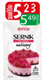
sernik malinowy 154g