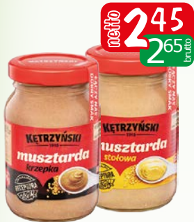
musztarda 170g krzepka, stołowa