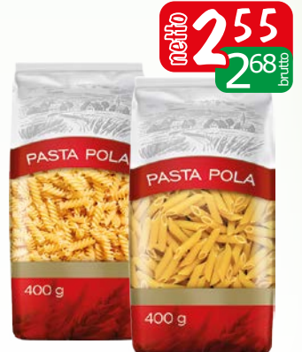
makaron pasta pola 400g penne, fusili