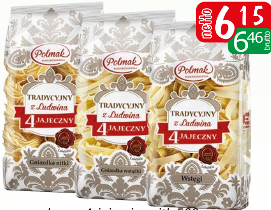
makaron 4-jaj gniaz.nitk 500g makaron 4-jaj gniaz.wstęgi 500g makaron 4-jaj wstęgi 500g