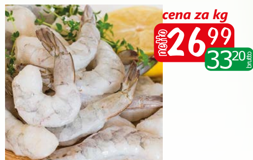
krewetka 31/40 surowa obrana z ogonkiem luz

Oferta aktualna jeżeli nie wystąpił błąd w druku lub do wyczerpania zapasów.