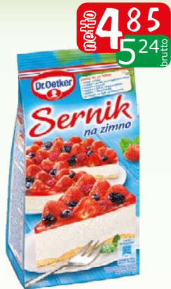
ciasto sernik na zimno 193g