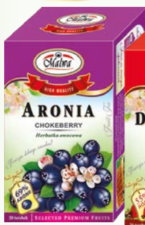
her. ex 20x2g aronia, owoc głóg, owoc róży, owocowa