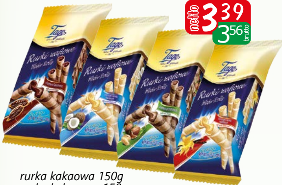
rukka kakaowa 150g rukka kokosowa 150g rukka orzechowa 150g rukka waniliowa 150g