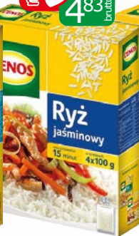
ryż jaśminowy 4x100g