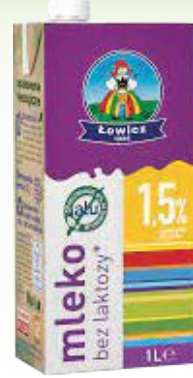
mleko łowickie b/lak 1,5% 1l uht