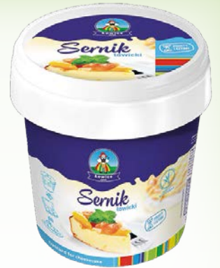
twaróg sernikowy 1 kg