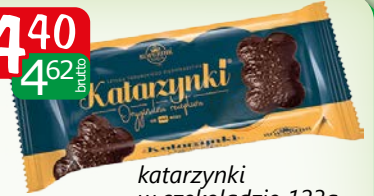
katarzynki w czekoladzie 123g