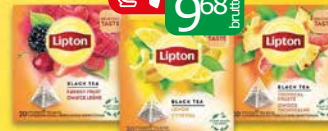
Lipton piramidki 20tb