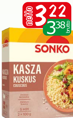
kasza kuskus 2x100g