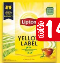
Lipton Yellow Label 88tb