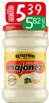
majonez stołowy kętrzyński 280g