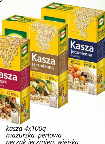
kasza 4x100g mazurska, perłowa, pęczak jęczmieni, wiejska