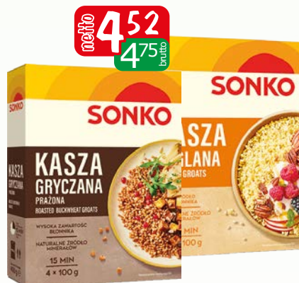
kasza gryczana prażona 4x100g kasza jaglana 4x100g