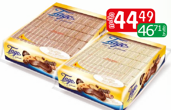
wafle kakaowe mini 2.5kg wafle waniliowe mini 2,5kg