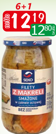
Filet z makreli w zalewie octowej 800g