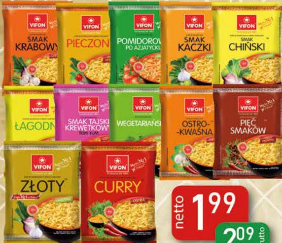
Zupa Błyskawiczna 70g Krabowa, Kurczak Pieczony, Pomidorowa po Azji, Kaczka, Kurczak Chiński, Kurczak Łagodny, Krewetkowa, Wege, Ostro-kwaśna, 5 Smaków, Kurczak Złoty, Kurczak Curry