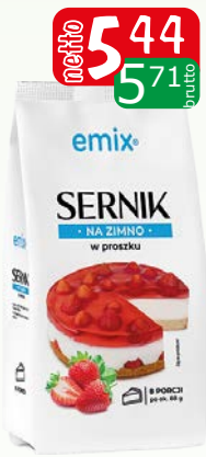
sernik na zimno 154g