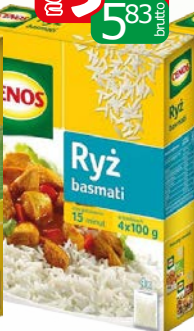
ryż basmati 4x100g