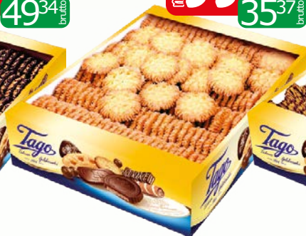
ciast sniezynki 2kg