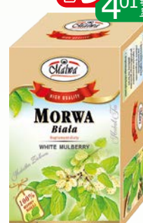
her. morwa biała ex 20x2g

Oferta aktualna jeżeli nie wystąpił błąd w druku lub do wyczerpania zapasów.