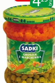
marchew z groszkiem i kukurydzą 460g