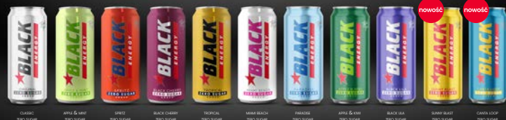
CLASSIC 500 ml, APPLE & MINT 500 ml, SPICY 500 ml, BLACK CHERRY 500 ml, TROPICAL 500 ml, MAMA BEACH 500 ml, TROPIC 500 ml, APPLE & MINT 500 ml, BLACK TEA 500 ml, BERRY BEAT 500 ml, CAROL LOOP 500 ml