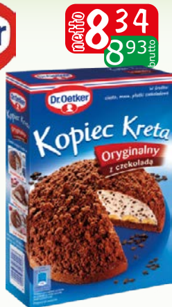
ciasto kopiec kreta 410g