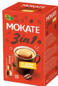
kawa 3w1 br sugar 12x17g mokate kawa 3w1 12*17g