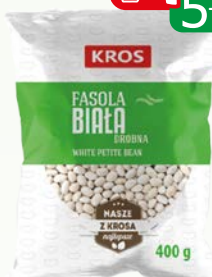
fasola drobna 400g