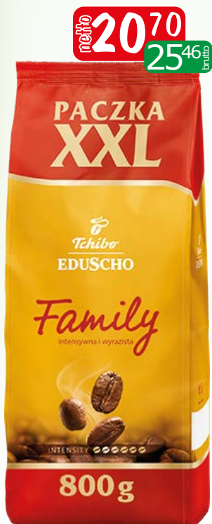
kawa mielona family 800g