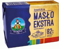
masło łowickie 200g