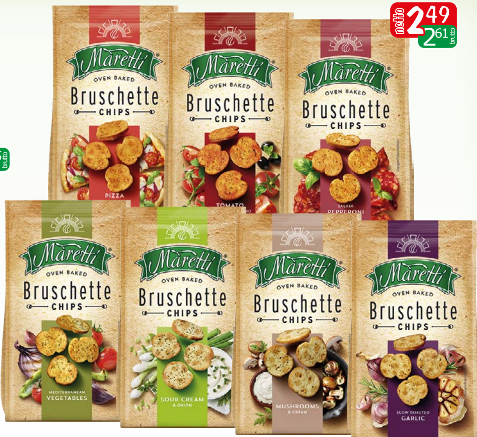
bruchetta 70g czosnek, grzyby, mix warzyw, pizza, pomidor, salami peperoni, smietana/cebula