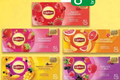
Lipton herbatki owocowe 20tb