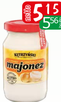
majonez kętrzyński o smaku smażonej cebulki 220g