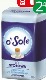
sól stowowa jodowana a10 1kg