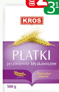
płatki jęczmienne błyska 500g