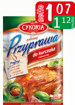
przyprawa do kurczaka 40g