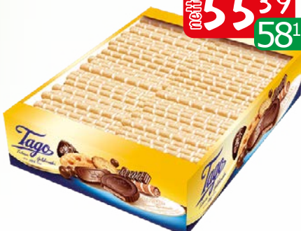
rukka kakaowa 3kg rukka kokosowa 3kg