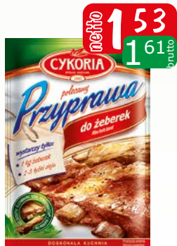
przyprawa do żeberka 30g