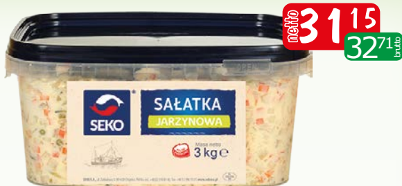
Sałatka jarzynowa 3kg