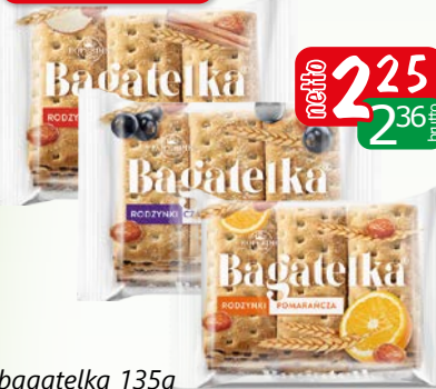
bagatelka 135g czarna porzec., jabłko cynamon, pomarańcza