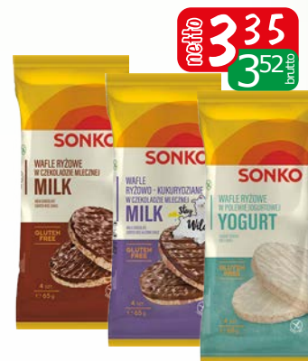
wafle ryż.w pol./jogurt 65g wafle.ryż.w czek./mlecz 65g