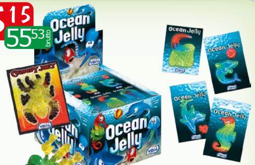
želki 66x11g dinozaury, robaki, zwierzęta morsk