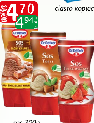
sos 200g słony karmel, toffi, truskawkowy