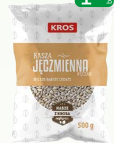
kasza pęczak 500g