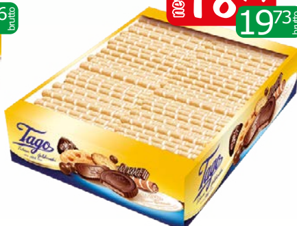
rukka pusta 1kg