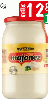
majonez stołowy 815g