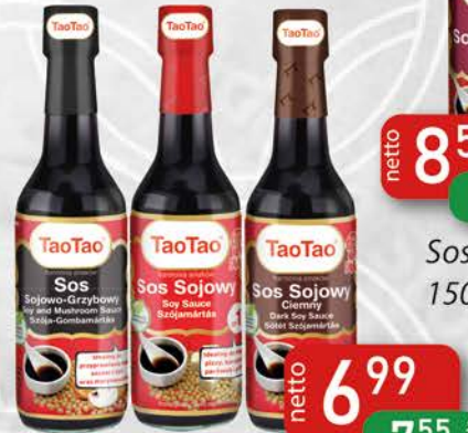
Sos 150 ml Sojowo-Grzybowy, Sojowy, Sojowy Ciemny