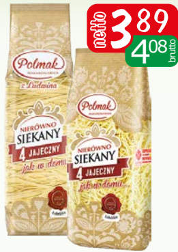
makaron nierówno siekany 250g kluska, krajanka