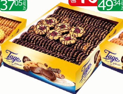
ciast stonczeni dekor 2.5kg