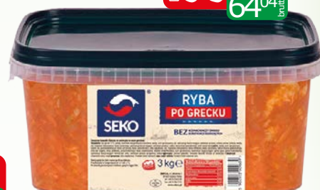
Ryba po grecku 3kg