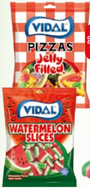
želki arbuz 90g želki fasolki 85g želki pizza 90g