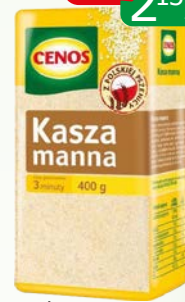
kasza manna 400g