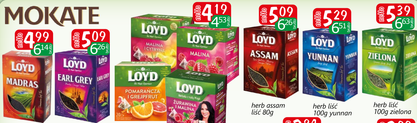
herb madras liść 100g