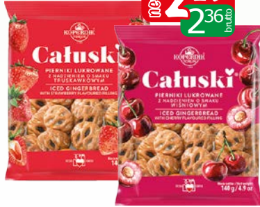
pierniki ciatuski truskaw 140g pierniki ciatuski wiśnia 140g