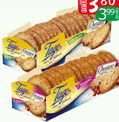
ciast owsiane z sezamem 185g