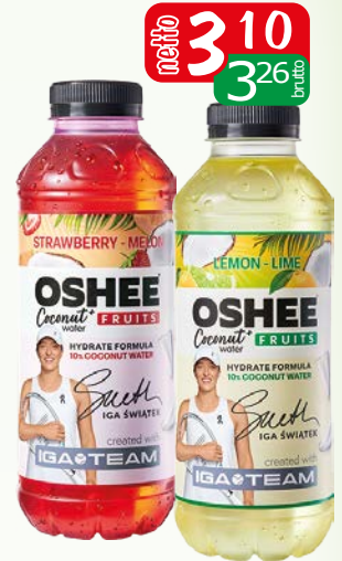
oshee water coco 555ml cytr., trusk.