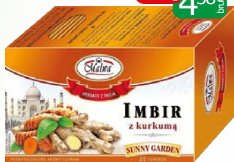
her. imbir z kurkumą ex 20x2g