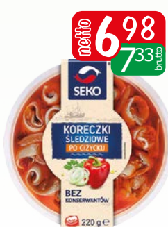
Koreczki śledziowe po giżycku 220g