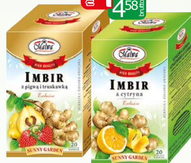
imbir ex 20x2g cytryna, pigwa+truskawka