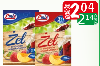
żel do dżemów 2:1 40g żel do dżemów 3:1 30g