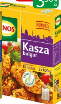
kasza bulgur 3x100g