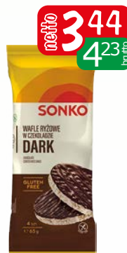
wafle ryż.w czek./deser 65g wafle.ryż.kuk.kids w cz./ml 65g