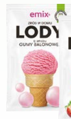
lody domowe asortyment 60g