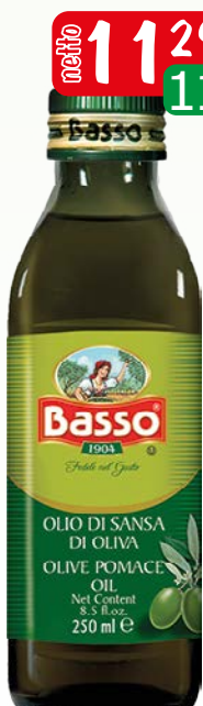
oliwa basso 0,25l