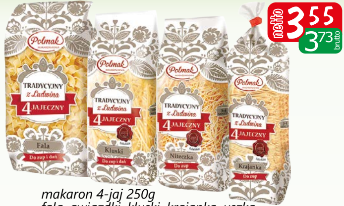
makaron 4-jaj 250g fala, gwiazdki, kluski, krajanka, uszka, muszelki, niteczka, ryżyk, świderk