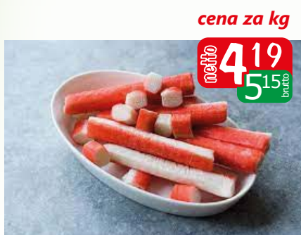
Paluszki krabowe surimi 250g