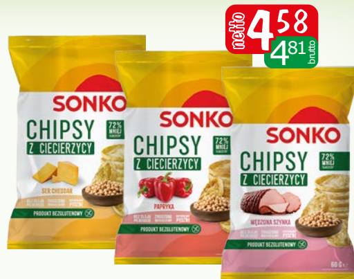
chipsy z ciecic.cheddar 60g chipsy z ciecic.papryka 60g chipsy z ciecic.szynka w. 60g