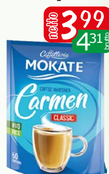
śmietanka carmen classic 200g