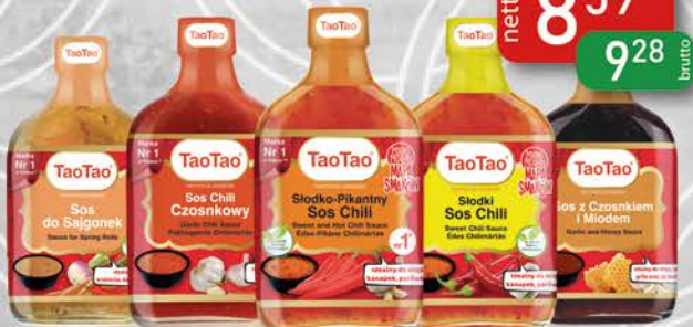
Sos 200-220 g do Sajgonek, Chili Czosnkowy, Chili Słodko-Pikantny, Chili Słodki, z Czosnkiem i Miodem