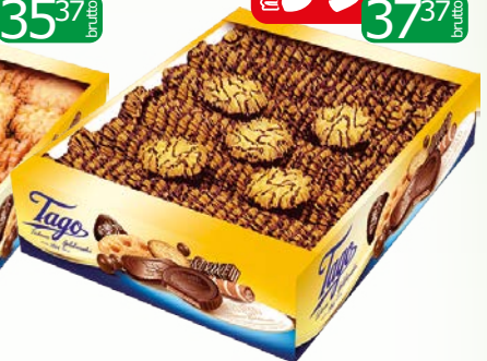
ciast sniezynki dekor 2kg