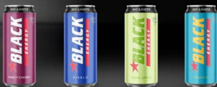
TROPIC 500 ml, DIABLO 500 ml, TROPIC 500 ml, TROPIC 500 ml