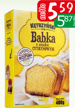
babka cytrynowa 400g