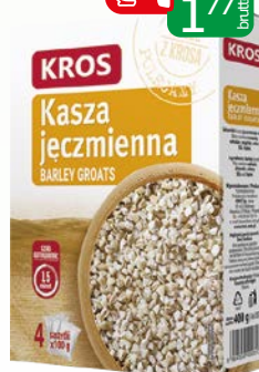
kasza jęczmienna 4*100 400g