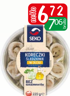
Koreczki śledziowe w oleju 220g