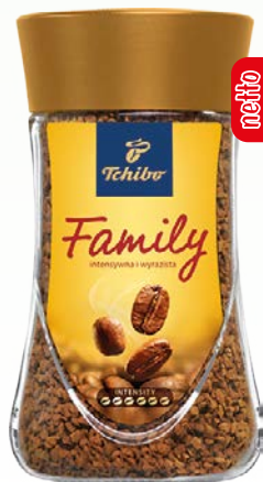
kawa rozpuszczalna family 200g