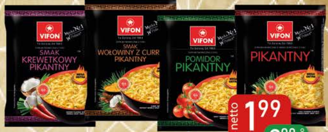
Zupa Błyskawiczna 70g Krewetka Pikantny, Pomidor Pikantny, Kurczak Pikantny, Wołowina z Curry