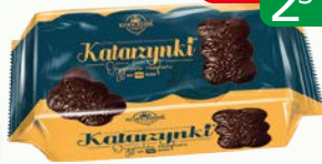
katarzynki w czekoladzie 56g