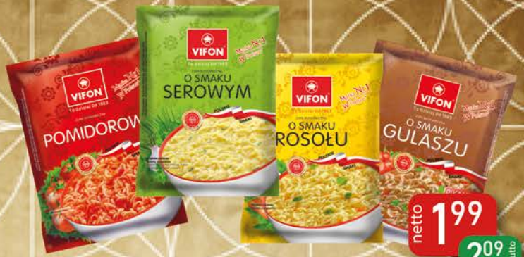
Zupa Błyskawiczna Polskie Smaki 65 g Pomidorowa, Serowa, Rosół, Gulaszowa