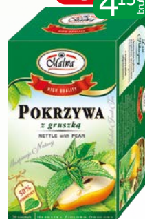
her. ex 20x2g melisa z pomar, pokrzywa grusz