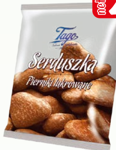
ciast serdusz piern lukr 160g