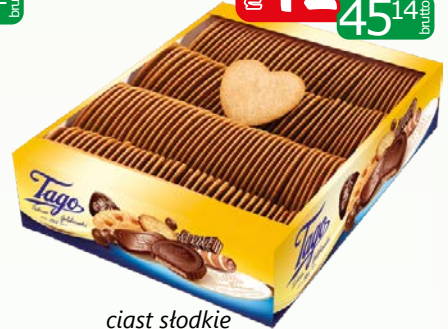
ciast srodkie serduszka 2.5kg