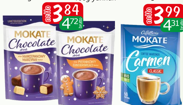
napój czek.120g o sm.marcepan, o sm.piernika