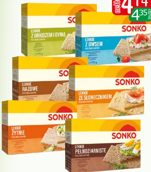
pieczywo lekkie 170g asortyment