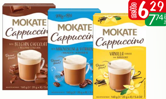
capp kart (20x8g) 160g czekol, magnez, wanil.