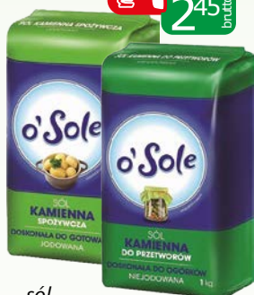
sól kamienna 1kg jodow., niejodowana