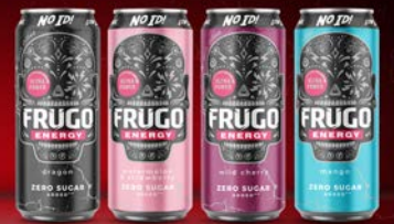
DRAGON 500 ml, WATERMELON & STRAWBERRY 500 ml, WILD CHERRY 500 ml, MANGO 500 ml

Kup 4 zgrzewki FRUGO ENERGY 500 ml NO ID NEEDED po 1 zgrzewce z każdego smaku a otrzymasz 1 x zgrzewkę FRUGO ENERGY NO ID NEEDED MANGO 500 ml*