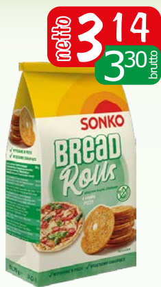
bread rolls 70g pizza