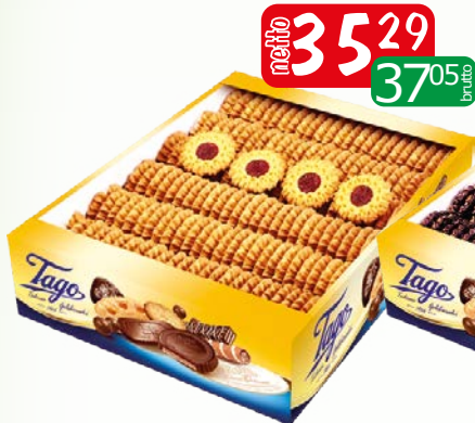
ciast stonczeni 2kg