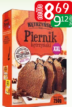
piernik kętrzyński 750g