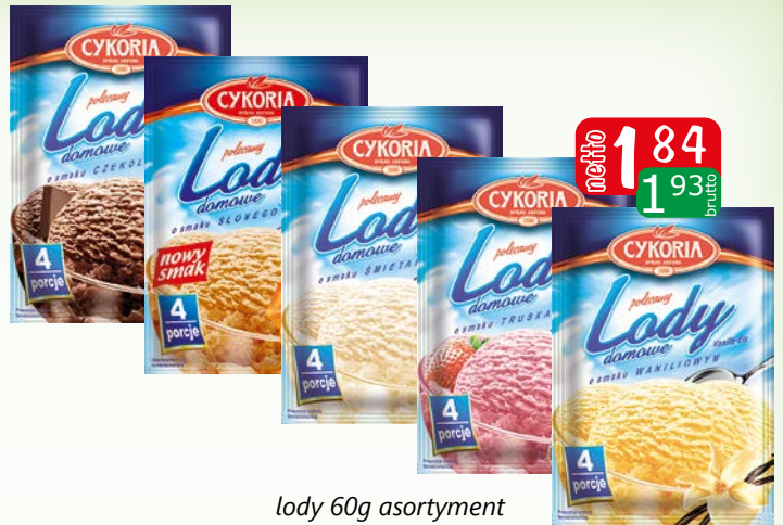
lody 60g asortyment