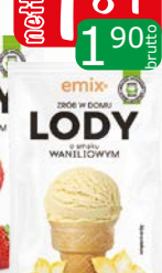
lody domowe waniliowy 60g