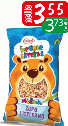
makaron wesole literki 250g