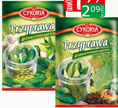
przyprawa do ogórków 45g kwaszonych, konserwowych