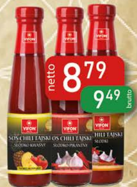
Sos Chili Tajski Słodko-Pikantny 700 g