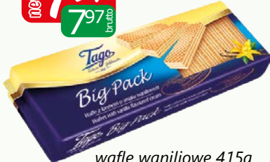
wafle waniliowe 415g