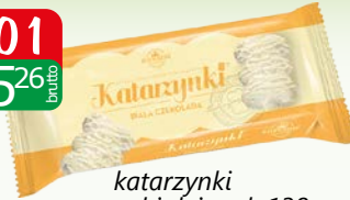
katarzynki w białej czek 138g