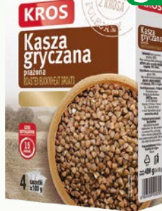
kasza gryczana 4*100 400g