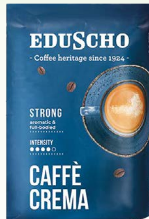
eduscho crema strong 500gr ziarno