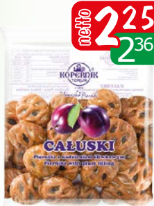
pierniki ciatuski 140g