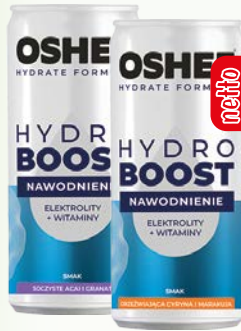
oshee hydroboost 250ml granat, maraku.