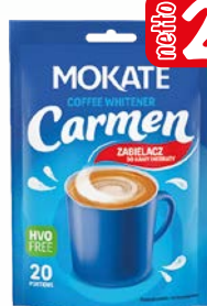
śmietanka carmen classic 80g