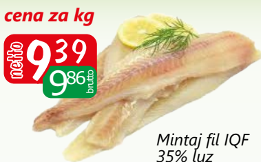
Mintaj fil IQF 35% luz