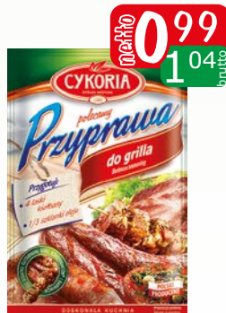
przyprawa do grilla 30g