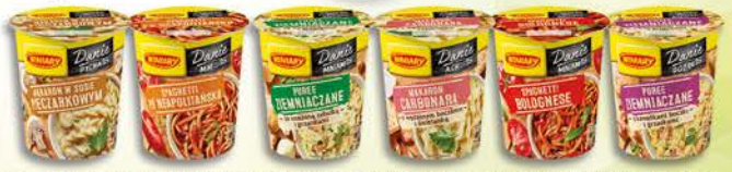
Winiary Danie w 5 Minut Spaghetti Napoli 57g, Puree Bekon 53g, Spaghetti Bolońskie 61g, Puree z grzankami Cebulowe 59g, Makaron z Pieczarkami 53g, Makaron Carbonara 50g