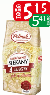
nierówno sekany 400g