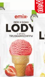
lody domowe truskawkowy 60g