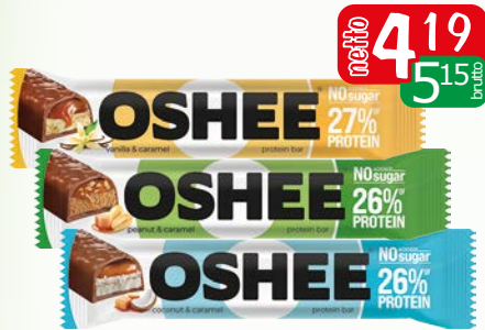
baton pr. 48-49g arachid- karmel, kokos karmel, wanilia-karmel