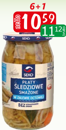
Płaty śledziowe smażone w zalewie octowej 800g