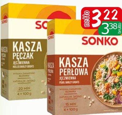
kasza jęczmien pęczak 4x100g kasza jęczmienna perl. 4x100