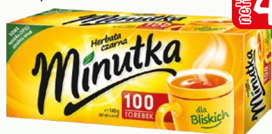
herb minut express ex100.140g