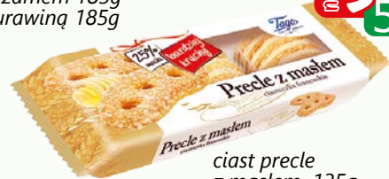
ciast precele z maslem. 135g