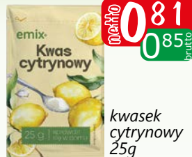
kwasek cytrynowy 25g