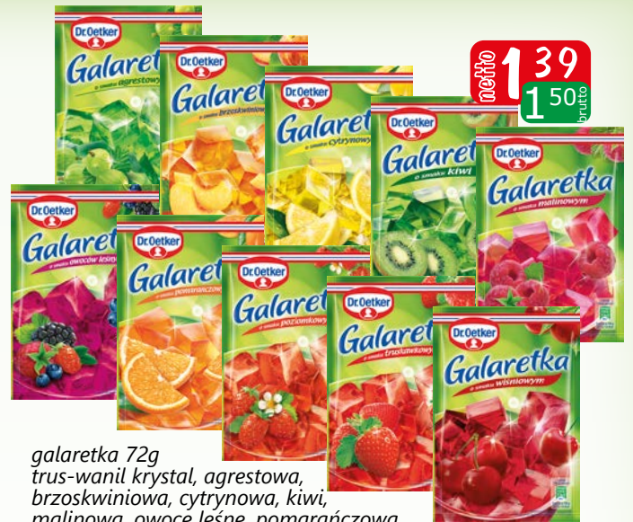
galaretka 72g trus-wanil krystal, agrestowa, brzoskwiowa, cytrynowa, kiwi, malinowa, owoce leśne, pomarańczowa, poziomkowa, truskawkowa, wiśniowa