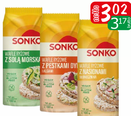
wafle ryż.7 ziaren z dzi 130g wafle ryż.naturalne 130g wafle ryż.z pestk dnyi 130g wafle ryż.z solą morską 130g wafle ryż.ze słonecznik. 130g