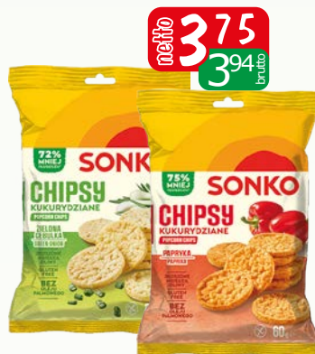
chipsy kukur. 60g ziel.cebulka, papr.