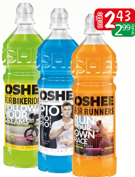
napój izoton. 750ml asortyment