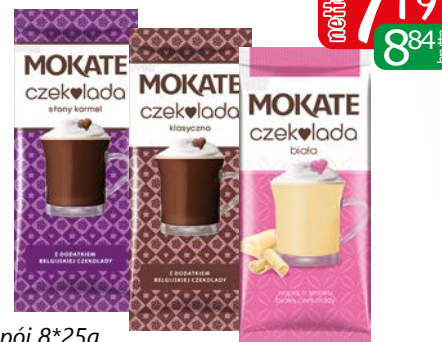
napój 8*25g czek. st.karmel, czek.biata czekol., czek.mleczna

Oferta aktualna jeżeli nie wystąpił błąd w druku lub do wyczerpania zapasów.