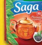
Saga herbaty czarna 90tb