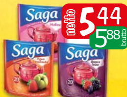
Saga herbatki owocowe 20tb