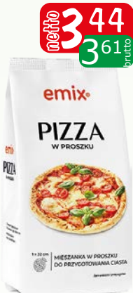
ciasto pizza 225 g