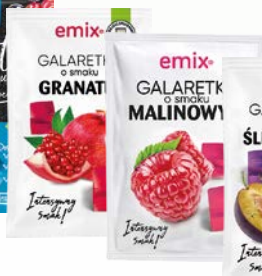
galaretki granat 75-79g