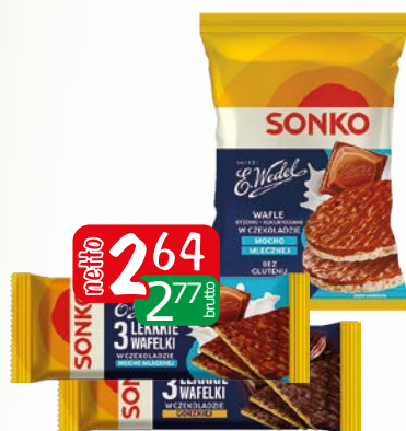
wafle lekkie w czek.moc.ml 36g wafle ryż.kuk.w czek.m.ml.30g wafle 3 ziarna czek./mlecz.36g wafle lekkie w czek.moc.ml 36g wafle lekkie w czek.moc.ml 36g wafle ryż.kuk.w czek.m.ml.30g wafle lekkie w czek.gorz. 36g wafle ryż.kuk.w czek.m.ml.30g