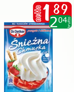
śnieżna chmurka 60g