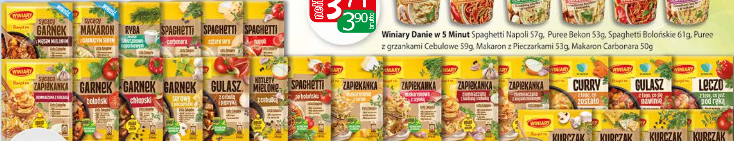
Winiary Pomysł na Danie w 5 Minut Kotlety Mielone 69g, Kotlety Mielone 69g, Gulasz 47g, Gulasz 42g, Curry 30g, Leczo 35g, Zapiekanke Serowa 47g, Zapiekanke Z Szynka 35g, Zapiekanke Ziemniaczana Z Mięsem 42g, Sycaca Zapiekanka z Kielbasa 41g, Kurczaka Smi Ziol 30g, Kurczaka Z Pieczarkami 32g, Kurczaka Sos Serowy 28g, Kurczaka Z Mozzarella 35g, Boloński Garnek 45g, Sycacy Garnek Mięso Mielone 39g, Chlopski Garnek 40g, Serowy Garnek 34g, Spaghetti Po Bolońsku 44g, Sycaca Makaron Z Serem 28g, Spaghetti Napoli 47g, Spaghetti Napoli 47g, Spaghetti Carbonara 34g, Spaghetti 4 Sery 31g, Rybę Smi Koper 32g