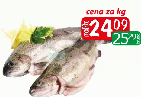
Pstrąg patroszony 300/350 IQF luz