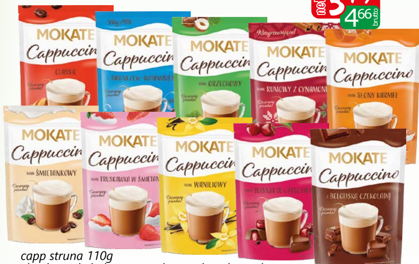
capp struna 110g classic, czekoladowe, orzechowe, stony karmel, wiśnie w cz., waniliowe, z magnezem, śmietankowe, trusk.w śmi., rum z cyn.