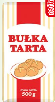
bułka tarta 500g