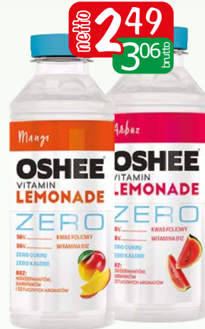
oshee lemon. zero 555ml arbuz, mango