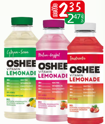
oshee lemoniada 555ml cyt/sosn, mal/grej, truskaw.