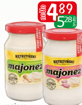
majonez kętrzyński 220g chrzanowy, czosnkowy